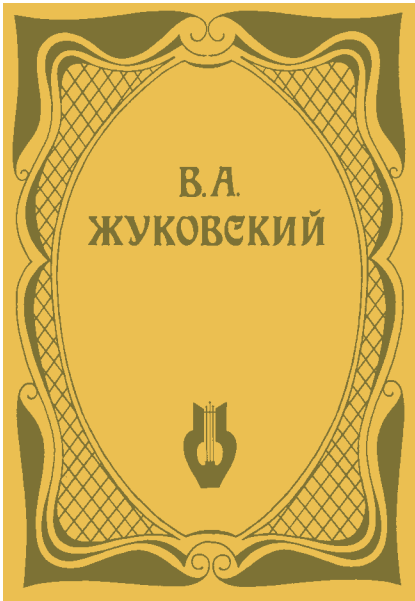
Оправа. Ілюстрація. 1983 р.