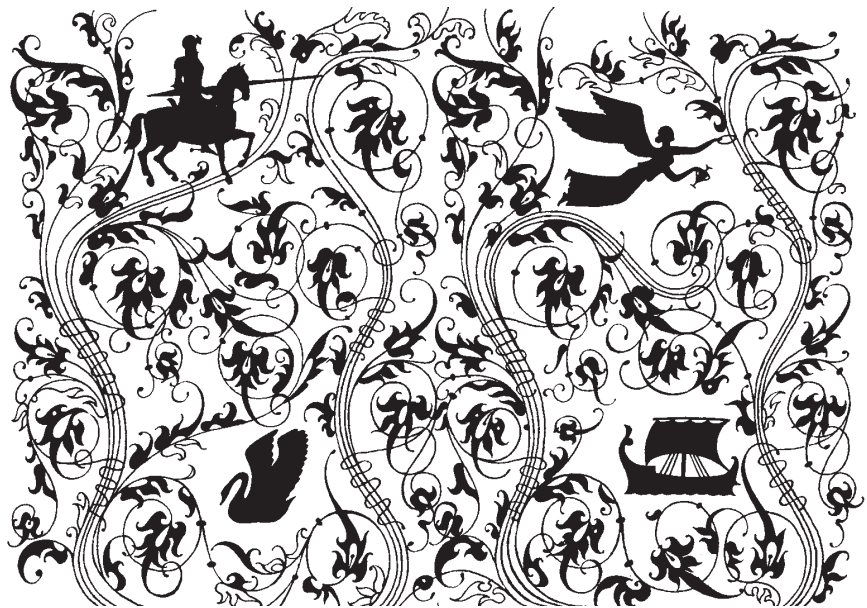
Форзац до збірника поезій В. А. Жуковського. 1983 р.