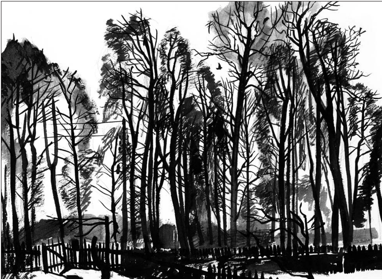
Підмосков'я. 1973 р. Папір, пензель