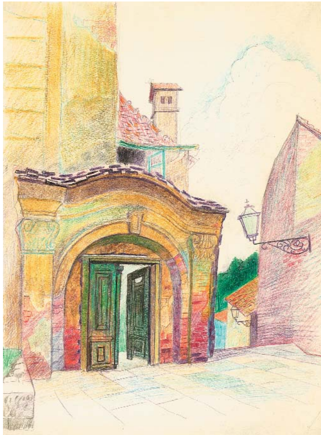
Старий Загреб. 1991 р. Кольоровий олівець

Не буду зосереджуватися на описі принад Адриатики — про них написано чимало.