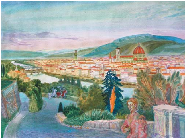
Флоренція. 2002 р. Акварель