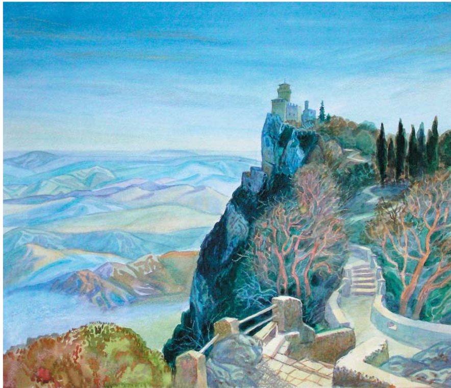
Каррара. 2002 р. Акварель, пастель