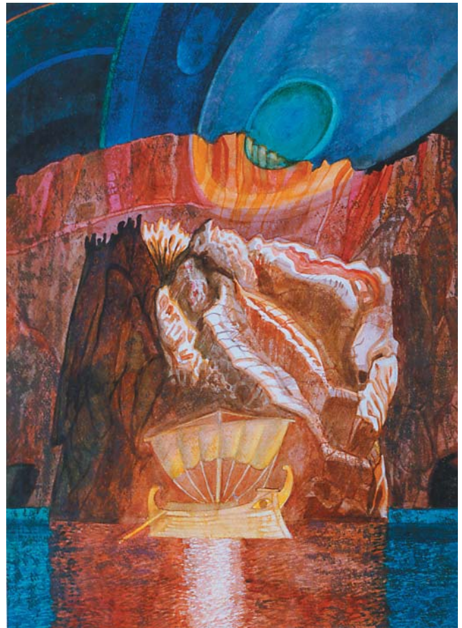
Повернення комети Галлея із серії «Зворотній зв'язок». 1992 р. Акварель, темпера