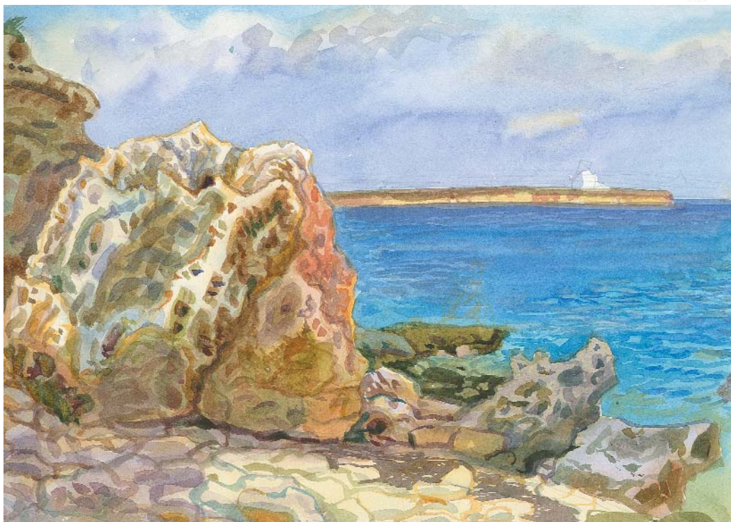
Скіфські береги із серії «Тарханкут». Два аркуші. 2003 р. Акварель