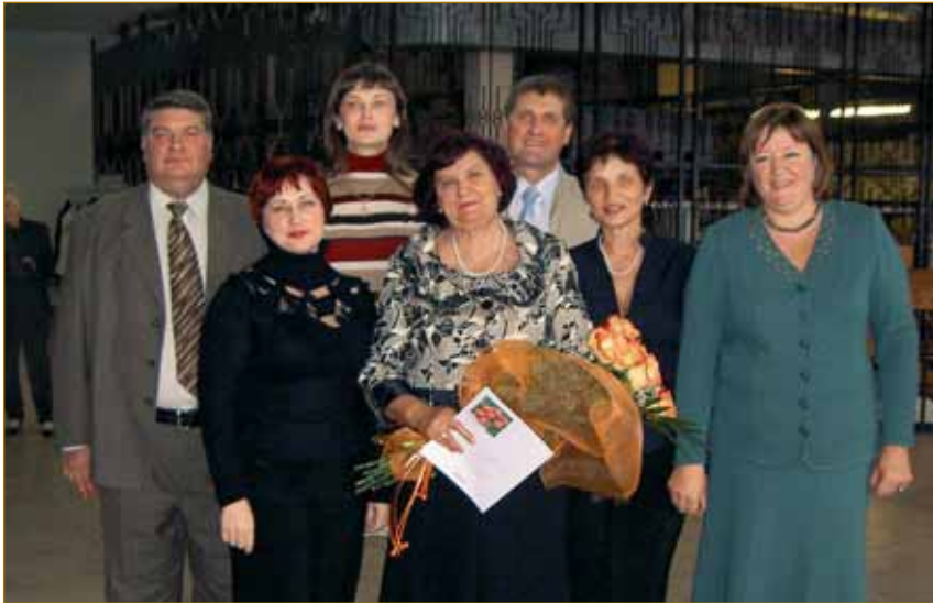
Викладачі факультету управління економікою

технічним забезпеченням підприємства і його підрозділів, керуванням підприємствами, державним управлінням.