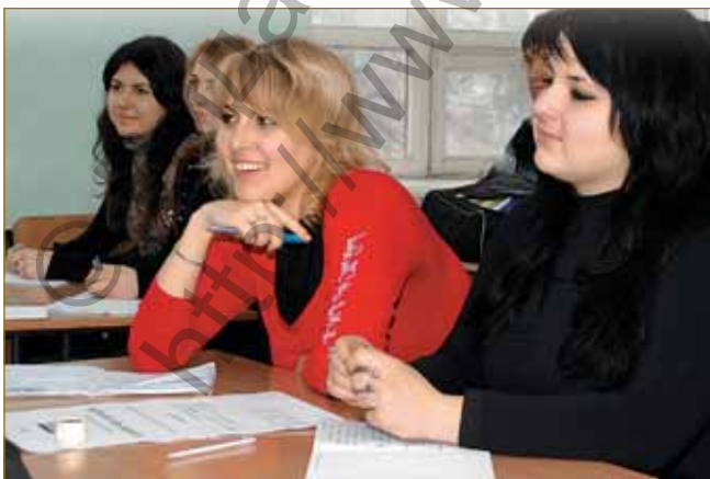
Під час лекції

Випускники спеціальності «Економіка підприємства» підготовлені до діяльності, пов'язаної з економічними розрахунками і прогнозуванням, проектним аналізом та бізнес-плануванням, оцінюванням кредитоспроможності та надійності юридичних чи фізичних осіб, організацією оплати і стимулювання праці, дослідженням та аналізом ринків, збутом і організацією продажів, матеріально-