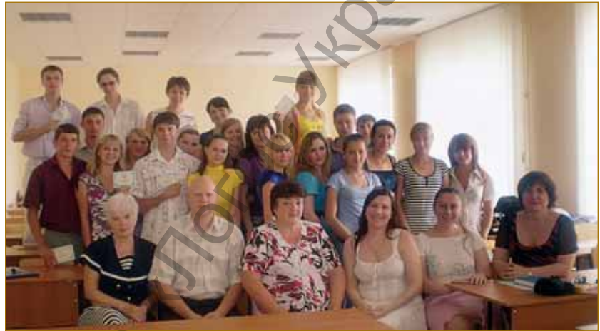
Перший випуск бакалаврів зі спеціальності «Оподаткування»

освітніх і професійних потреб регіону, надання населенню можливостей для підвищення свого освітнього та професійного рівня. Підготовка сучасних фахівців з оподаткування зорієнтована на розширення професійної підготовки і використання випускників університету не лише у виробництві, а й у сфері соціального захисту, що включає державні підприємства, комерційні фірми, акціонерні товариства, товариства інших форм власності, корпорації, концерни, об'єднання, спільні підприємства всіх форм власності, різні фонди служби зайнятості, соціального і пенсійного страхування і т. ін.