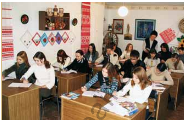
Студенти на заняттях

У відділенні модернізуються сучасні освітні технології, впроваджуються стандартизовані методики кількісного і якісного оцінювання знань студентів, використовуються інформаційні технології в навчальному процесі, зокрема проведення комп'ютерної психодіагностики та підсумкового тестування в програмі «Колоквіум+», поповнюється банк сучасних