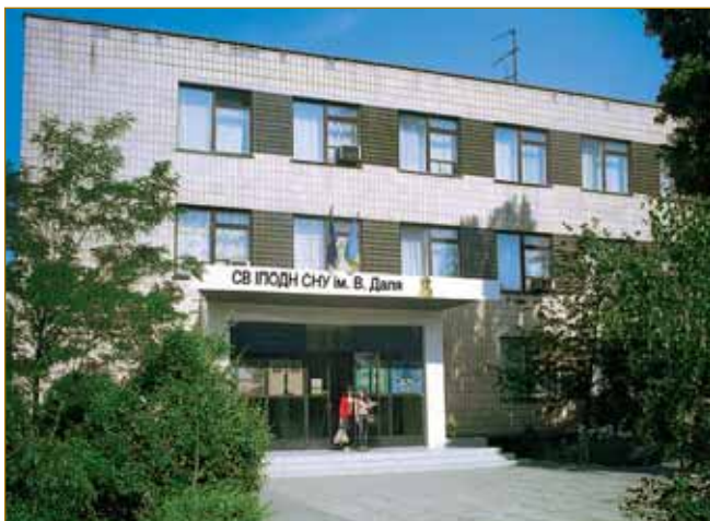
Навчальний корпус ІПОДН

Стрімкий розвиток технічного прогресу та інформатизації в Україні зумовив формування попиту на робітників, які мають найсучасніші теоретичні знання й практичні навички. Тому одним із пріоритетних напрямків діяльності ІПОДН є надання освітніх послуг на замовлення Луганського обласного та міського центрів зайнятості, промислових підприємств Луганська і області, інших юридичних та фізичних осіб із підвищення кваліфікації фахівців різних кваліфікаційних рівнів. Основними перспективними напрямками в роботі з підвищення кваліфікації на сьогодні є курси за програмами: «Організація перевезень і управління на залізничному транспорті», «Перевезення небезпечних вантажів залізничним транспортом», «Основи бухгалтерського обліку», «Сучасні комп'ютерні технології в бухгалтерії», «Вивчення сучасних комп'ютерних технологій», «Новітні комп'ютерні технології», «Сучасні комп'ютерні технології в мережі Інтернет», «Правознавство на сучасному етапі», «Правові та практичні аспекти державних закупівель в Україні», «Визначення ознак справжності і платіжності банків національної валюти, банків іноземних держав та дорожніх чеків».