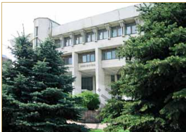
Наукова бібліотека СНУ ім. В.Даля сьогодні

Університетська корпоративна універсальна мережа дозволяє користувачам (викладачам, співробітникам, студентам) незалежно від свого місцезнаходження (бібліотека, кафедра, лабораторія) швидко одержати інформацію з електронного каталогу чи інших баз даних про наявність документів, що знаходяться в бібліотеці. Широке використання в бібліотечній практиці комп'ютерів, нових інформаційних технологій докорінно змінило нашу роботу, підняло на новий рівень обслуговування читачів, відкрило необмежений доступ