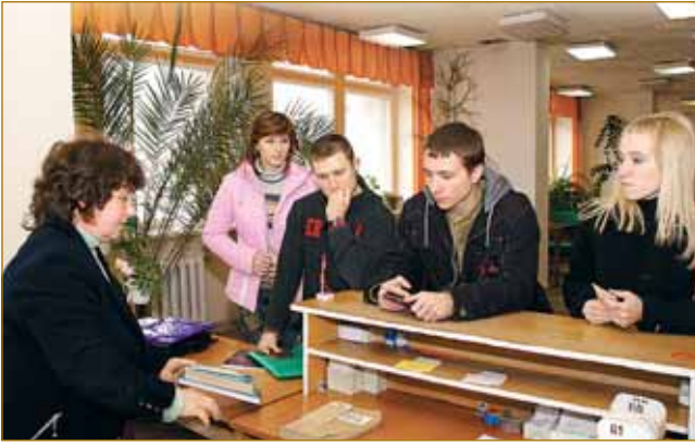
Робота з читачами

документів та бібліографічні бази даних, що генеруються бібліотекою. З 2004 року доступ до ЕК для користувачів організований в онлайнному режимі через сайт бібліотеки.