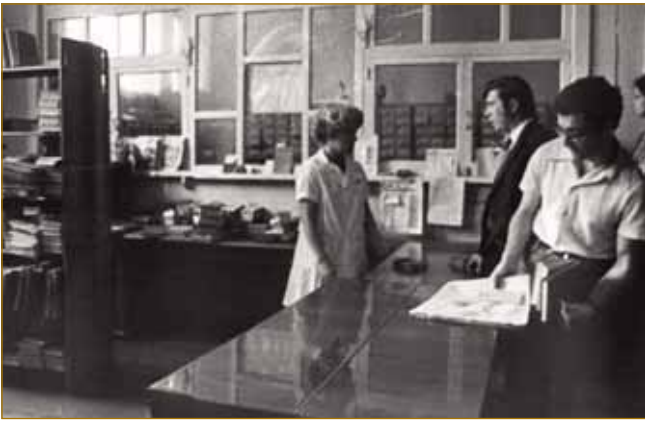
Приміщення бібліотеки машинобудівельного інституту