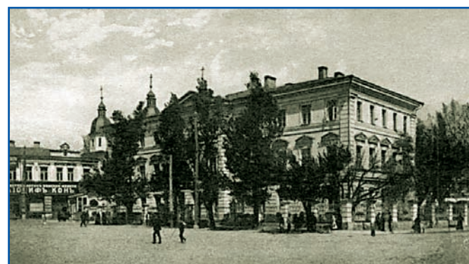
Київська духовна академія, яка до заснування Педагогічного інституту при університеті Св. Володимира опікувалася підготовкою вчителів

Фундатор Київського світського навчального округу Є. Ф. фон Брадке ніколи не вчителював. Він був типовим управлінцем — керував і землевпорядкуванням у Фінляндії, і створенням навчального округу та університету в Києві. Авторитетні сучасники Єгора Федоровича відгукувалися про нього із симпатією. Керуючи Київським навчальним округом (1832–1839), він виявив себе старанним виконавцем директив російського уряду. Саме звідси, напевно, і вищезгадані симпатії. Фон Брадке провів у життя постанову Міністерства народної освіти «Про заборону російському юнацтву навчатися в іноземних єзуїтських училищах» від 16 серпня 1822 р. Згодом повів послідовний наступ на історично усталену плюралістичну структуру різних за національно-конфесійною спрямованістю типів училищ. Високого урядовця непокоїла та обставина, що всі повітові училища в Київській, Подільській і Волинській губерніях, за винятком м. Києва, знаходилися в руках римсько-католицького духовенства і навчання в них відбувалося польською мовою. «Такі училища, — писав він, — шкідливі тим, що через них римсько-католицьке