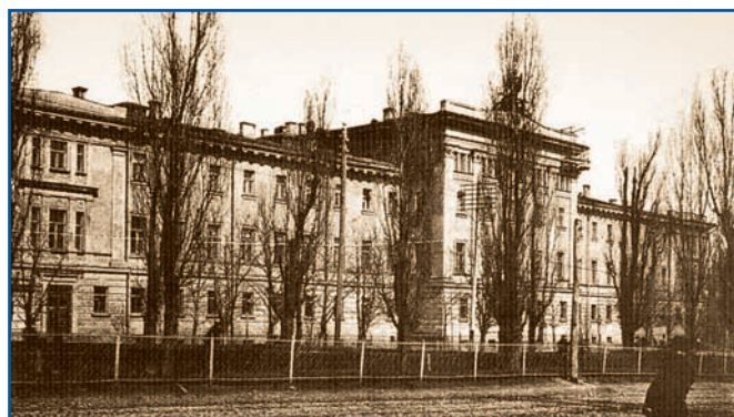
Будівля, в якій розміщувалась Перша гімназія після її переміщення з Липок

Принагідно перерахуємо інші чини «Табелі», оскільки відповідно до них ранжувалися учительські та академічні посади і звання в Російській імперії аж до 1917 р. Чини XIII класу (провінційний секретар), XII (губернський секретар), XI (корабельний секретар) та X (колезький секретар) присвоювались, як правило, за вислугу років і більш високі учительські посади, надавалися студентам із недворянських верств і підвищувалися за мірою отримання університетських звань. Чини IX класу (титулярний радник), VIII (колезький асесор), VII (надвірний радник), VI (колезький радник), які відповідали армійським чинам старших офіцерів, наприклад, чин V класу (статський радник) прирівнювався до полковника, лише інколи присвоювалися заслуженим учителям, директорам