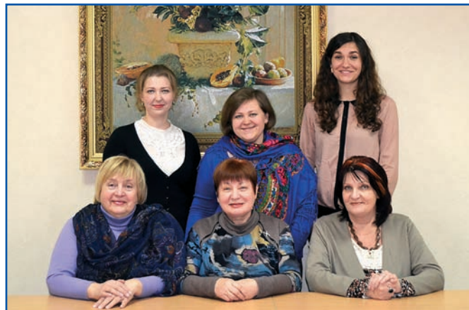
Колектив кафедри дитячої творчості

Серед наукових здобутків кафедри слід назвати підручник для студентів «Основи образотворчого мистецтва з методикою викладання в дошкільному закладі»