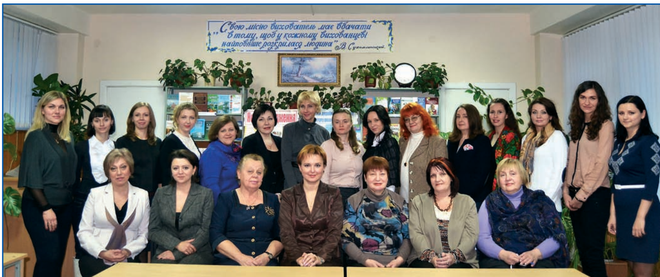
Колектив Інституту розвитку дитини

Інститут розвитку дитини НПУ імені М. П. Драгоманова, поєднуючи здобутки багатьох поколінь знаних педагогів-драгомановців і новітні наукові досягнення у галузі навчання, виховання і розвитку дитини, бачить свою місію у підготовці фахівців, здатних до сприйняття дитинства як джерела і рушійної сили формування людини, а дитини – як унікальної особистості з безцінним потенціалом та неповторною життєвою траєкторією; спроможних своїм професіоналізмом і творчим завзяттям збудити її цікавість до навколишнього світу та допомогти повноцінному розвитку її обдарувань.