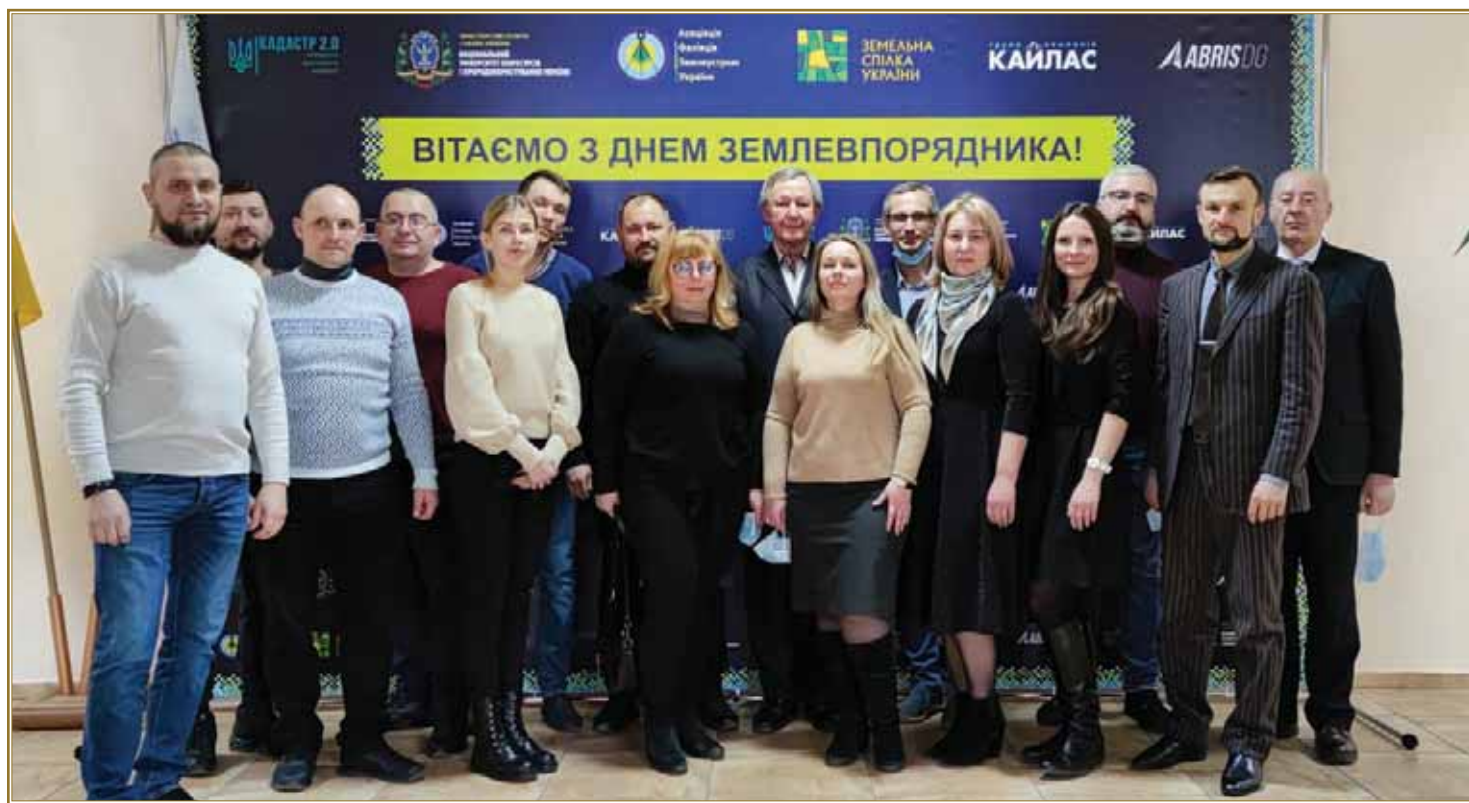
Слухачі та члени екзаменаційної комісії базового курсу з підготовки ліцитаторів, березень 2021 р.

Усвідомлюючи необхідність зростання професійного рівня практикуючих інженерів-землевпорядників, інженерів-геодезистів, оцінювачів з експертної грошової оцінки земельних ділянок, ліцитаторів, центр організовує навчальний процес так, щоб він був актуальним за змістом, різноманітним за формами, сучасним за засобами, якісним і ефективним за результатами.