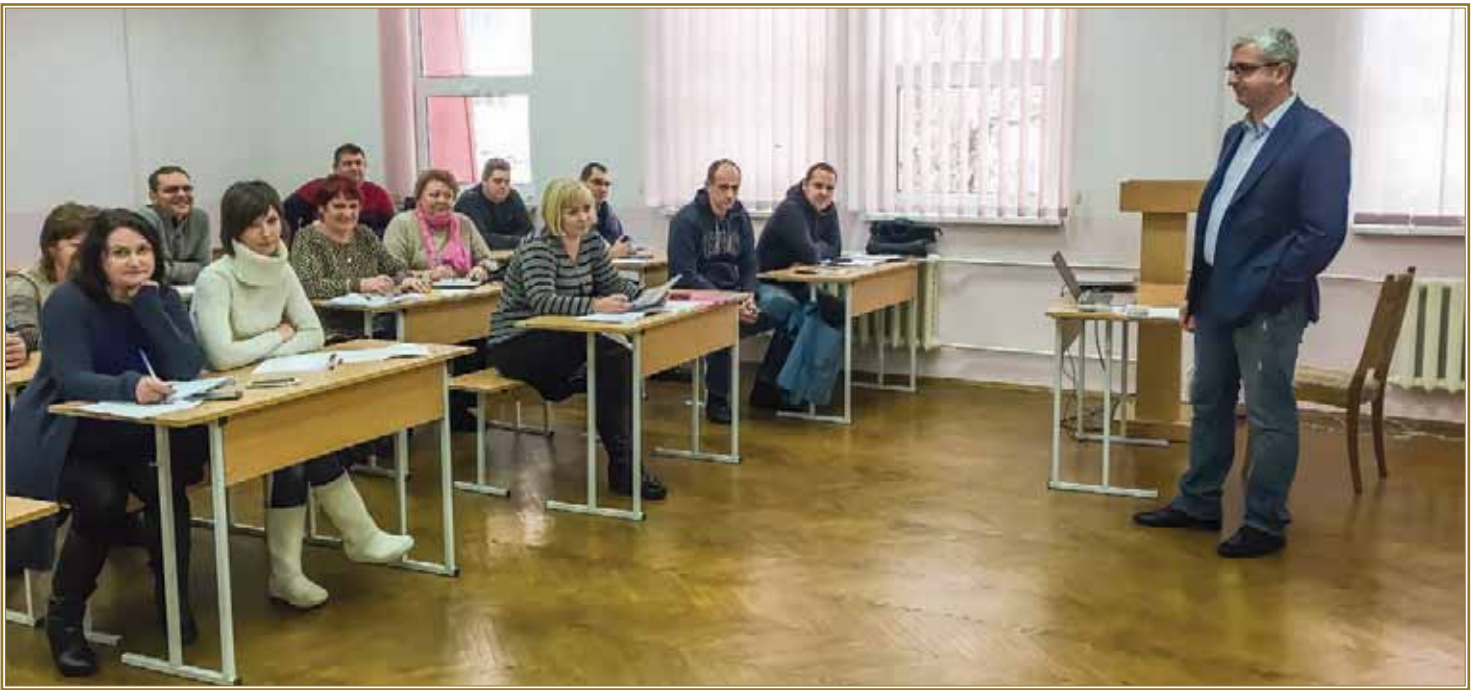
Проф. А. Г. Мартин проводить лекцію слухачам курсу підвищення кваліфікації оцінювачів з експертної грошової оцінки земельних ділянок