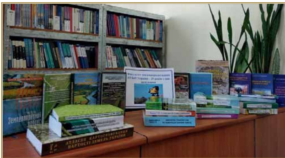
Виставка праць викладачів факультету землевпорядкування за останні 25 років

Для зручності користувачів 7 лютого 2006 р. у філію в корпусі № 6 передали з наукової бібліотеки абонементи