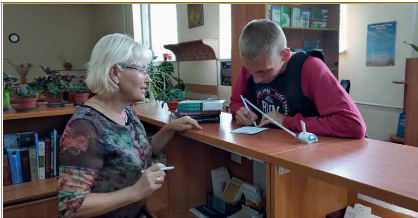
Обслуговування користувачів на абонементі

Наукова бібліотека, структурним підрозділом якої є філія, має фонд понад 1 млн друкованих видань державною мовою та мовами світу. Філія активно пропагує електронні ресурси наукової бібліотеки: «Цифрова бібліотека» (1200 видань), «Електронний каталог» з мережі Інтернет, «Електронна бібліотека» (7000 видань) з локальної мережі університету. Нещодавно стали доступними онлайн послуги: електронна доставка документів і допомога Служби інформаційного моніторингу. Популярна послуга серед студентів — електронна доставка документів. Із початку 2021 р. було доставлено 792 навчальних електронних видань (по факультету землевпорядкування — 426). Служба інформаційного моніторингу в науковій бібліотеці створена для допомоги науковій спільноті