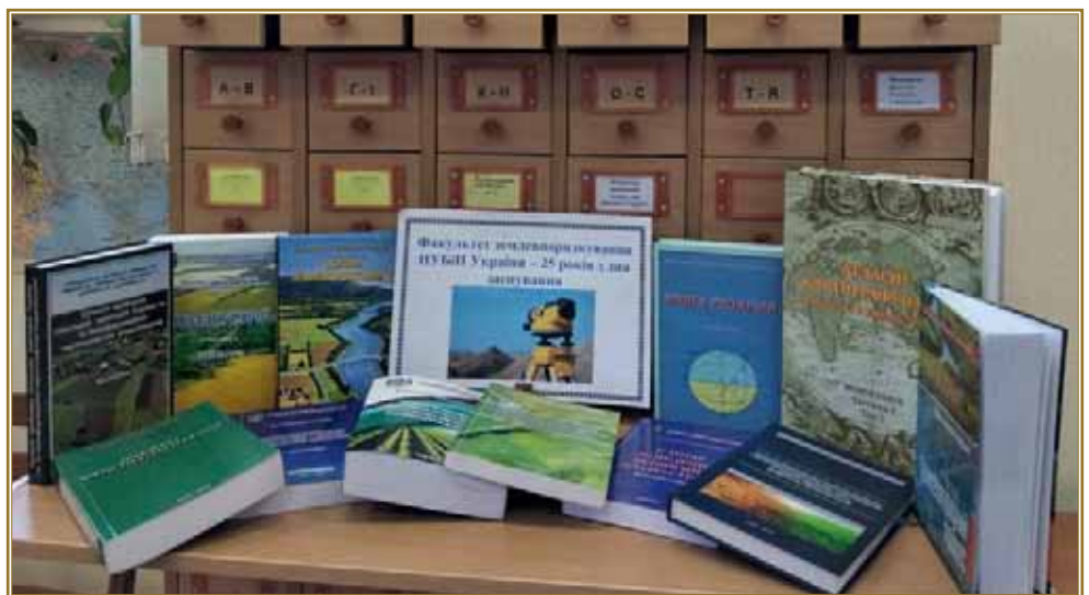
Тематична книжкова виставка «Факультет землевпорядкування НУБіП України — 25 років із дня заснування»