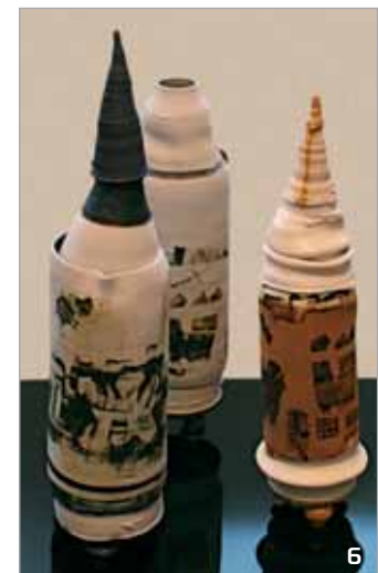
1. Ангел вилітає 1985. Шамот, авторська техніка. 60x50. 2. Літня спека 1989. Шамот, авторська техніка. 60x50. 3. Вазы «Весняний вітер» . 1982. Шамот, авторська техніка. 50x37. 4. Три сестри . 1992. Фарфор, авторська техніка. 80x25. 5. Ковчег (2) . 1987. Шамот, авторська техніка. 6. Собори душі . 1990. Фарфор. 90x25.