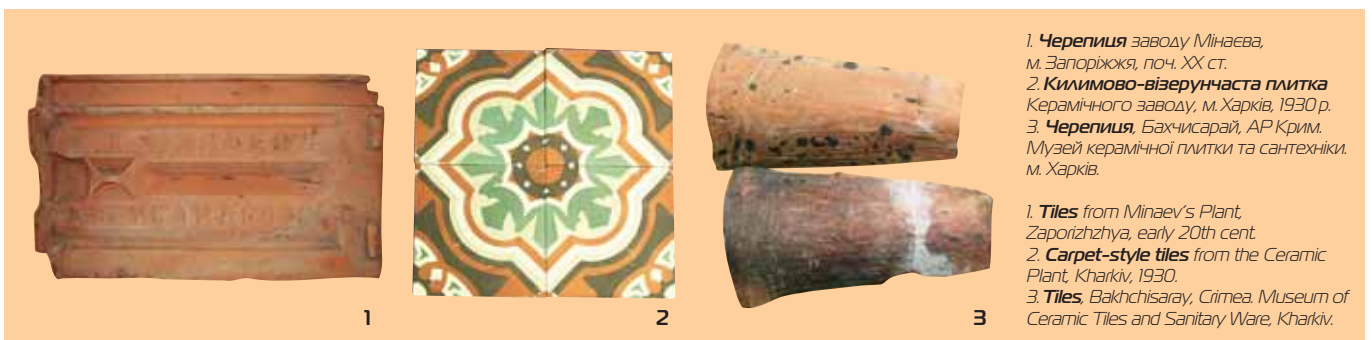
1. Черепиця заводу Мінаєва, м. Запоріжжя, поч. XX ст. 2. Килимово-візерунчаста плитка Керамічного заводу, м. Харків, 1930 р. 3. Черепиця, Бахчисарай, АР Крим. Музей керамічної плитки та сантехніки, м. Харків.

There are few centres of Ukrainian folk ceramics survived in present, in comparison to about 700 pottery centres 10 that existed in Ukraine at the beginning of the 20th century and which will never be restored as regards traditional