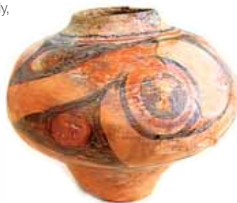
Кераміка етапу В II трипільської культури. Ceramics of B II stage of Trypillya Culture.