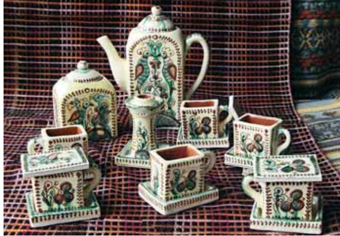
Традиції косівських майстрів продовжують студенти Косівського інституту прикладного та декоративного мистецтва ЛНАУМ. Автор Марія Боднар. Students of Kosiv Institute of Decorative and Applied Arts continue traditions of Kosiv's masters. Author Mariya Bodnar.

Clay is an earthy mineral or earthy debris, which, when combined with water or other liquids in a proper proportion, results in a plastic dough, which keeps its form unchanged after drying, whereas firing makes it stone hard.