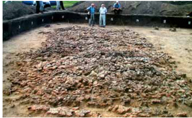
Археологічні розкопки на місці колишніх трипільських поселень. Archaeological excavations at site of extinct Trypillian settlements.

Висока культура хліборобів-гончарів проіснувала майже дві з половиною тисячі років (за М. Відейком). Трипільська культура внесла у світову цивілізацію відчутні здобутки у багатьох галузях. Найосновніше те, що вона дала людству розвинену нову технологію життя — хліборобство, котре визначило його подальшу долю на довгі тися-