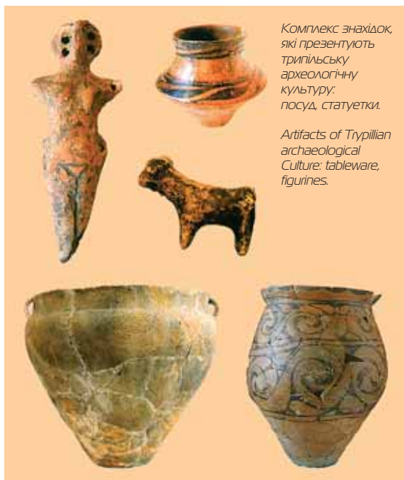
Комплекс знахідок, які презентують трипільську археологічну культуру: посуд, статуетки.

Отже, керамічне виробництво в Трипіллі набрало великих розмірів.