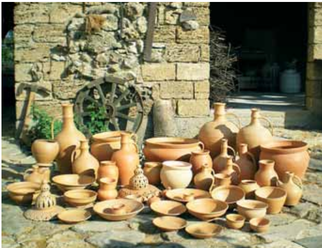
Гончарні вироби. Автор Рустем Скібін. Pottery by Rustem Skibin.

В історії вітчизняного гончарства однодискове ручне гончарне коло проіснувало до Х–ХІ сторіччя, коли було заступлене дводисковим.