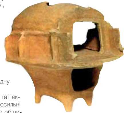
Двоповерхова модель трипільської будівлі. Поселення Розсохуватка, Черкаська обл. Model of a two-floor house. Settlement Rozsokhuvatka, Cherkasy oblast.

Всяка глина є сумішшю мінералів у різних кількісних співвідношеннях. Одна група цих мінералів, видалена з глин, позбавлена пластичності, друга ж виявляє ці властивості значною мірою. Ця група складових часток глини називається глинистою субстанцією. Залежно від мінерального (хімічного) характеру часточок розрізняють