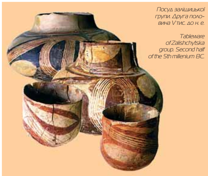
Посуд заліщицької групи. Друга половина V тис. до н. е.