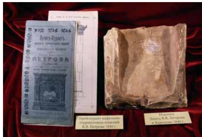
Прейскурант кахельно-теракотових виробів та вогнетривкої цегли, а також уламок кахлі заводу В. В. Петрова, м. Харків, 1840 р. Музей керамічної плитки та сантехніки, м. Харків. Price-list of tiles and terracotta ware and fire proof bricks, and also a tile shard from V. V. Petrov's Plant, Kharkiv. 1840. Museum of Ceramic Tiles and Sanitary Ware, Kharkiv.

І далі служать нам такі давні зразки архітектурної кераміки, як черепиця, кахля (найчастіше вже трансформована в облицювальну плитку). Усе це засвідчує універсальність сировини, а також універсальність