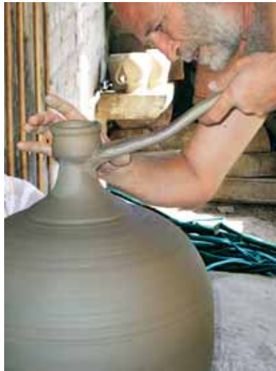
Гончар Сергій Спасьонов за роботою. Potter Serhiy Spasyonov at work.

There is another technological application of clay being widely used in Ukraine in different times, namely sculpture making (models of real size). Art bronzes today are cast using the very same process as that of ancient times. To build a sculpture of an original design it would require a specific type of clay. Fatty clay ( gley ) was mixed with wisps of hemp and modeled into a sculpture. Then a sectioned gypsum figure was replicated and a wax model cast for a bronze sculpture. If a sculpture was planned from marble or stone — after a clay model dried well, a special stippling machine was used to copy figuring of the clay model into stone model, and all the remains were hammered and chiseled off. This work requires many hours of hard hand labor. For