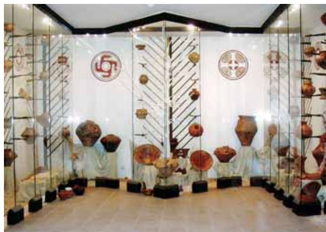
Експозиція гончарного посуду. Музей трипільської культури. Exposition of ceramic tableware. Museum of Trypillia Culture.

The Trypillian Culture of farmers-potters had lasted for almost two and a half millennia (according to Mykhailo Videiko) and made a considerable contribution to the world's civilization in many spheres. The major impact it had upon grain-growing, which determined humankind's development for the following thousands years. Monuments of Trypillia's civilization occupy an outstanding territory of 190,000 sq. km (in comparison Cucuteni Culture in Romania — 10,000 sq. km), the area unmatched by any other of archaeological cultures. Vikentiy Khvoika's major finds was ceramics: there were deposits