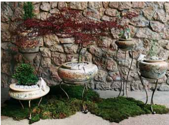
Декоративні керамічні кашпо «Сад мрій». Автор Тамара Золотіліна. 2007. Decorative ceramic flower pots Garden of Dreams . Author Tamara Zolotilina. 2007.

The first application of glaze siding in architecture instead of stone was also used in Egypt, with further development of decorative siding during the New Kingdom period (1700–1100 BC) focused on enriching glazes and their colours' brightness. A nice example is glaze siding in Tell-el Amar built belonging to the reign of Amenophis IV.