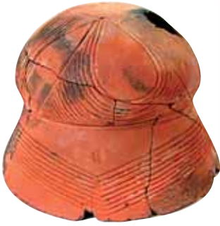
Кераміка етапу В I-II трипільської культури. Ceramics of B I-II stage of Trypillia Culture.