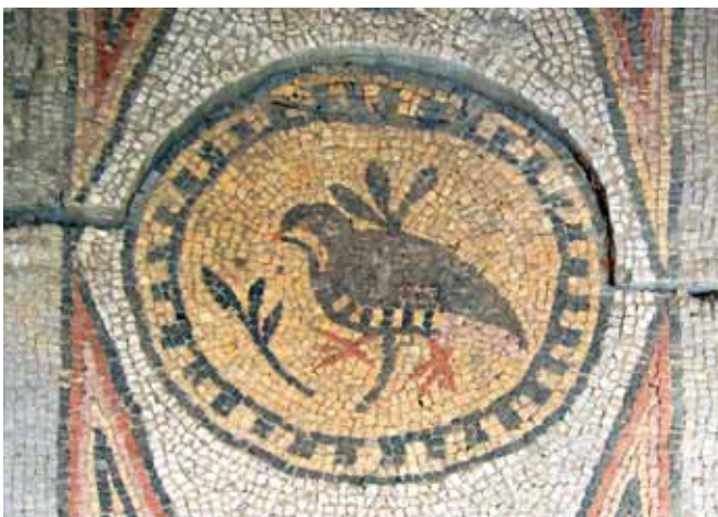
Фрагмент мозаїки на підлозі у християнському храмі Херсонеса, VI–X ст. Музей керамічної плитки та сантехніки, м. Харків. Fragment of a floor mosaic from Christian temples of Chersonese, 5th–10th cent. Museum of Ceramic Tiles and Sanitary Ware, Kharkiv.

The plinfа 's material was of high quality. For example, a plinfа used in construction of the Holy Sophia Cathedral takes a load of 80 kg/cm 2 ; Kyrylivska