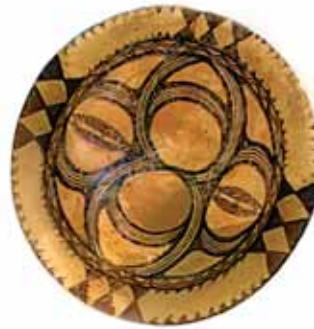
Кераміка етапу С II трипільської культури. Ceramics of C II stage of Trypillya Culture.

Eventually potters learned how to dry clay objects. At first sight it seems to be easy, nevertheless certain skills and knowledge are necessary for this operation. The main requirement for drying clay is to do it slowly, because a fast evaporation may result in high internal stress, and pots will get cracked. It is important also to