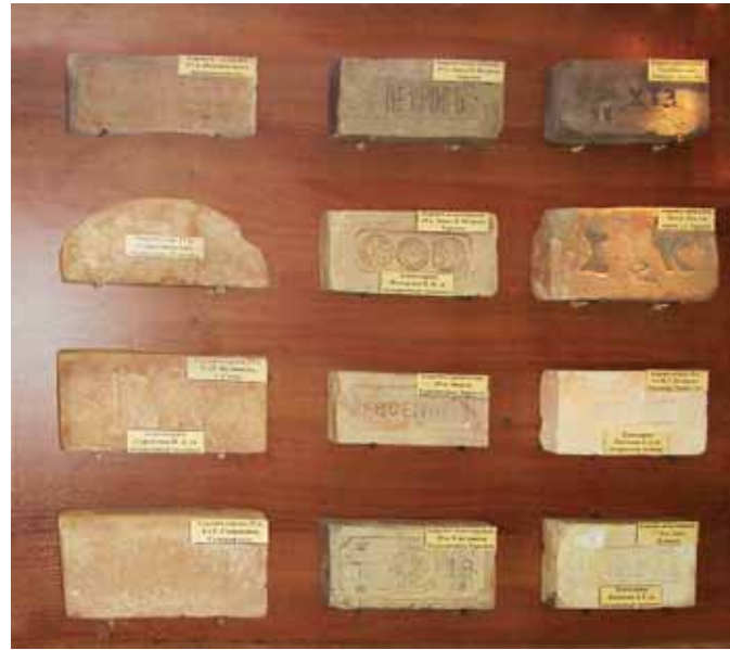
Колекція цегли XVII–XIX ст. Музей керамічної плитки та сантехніки, м. Харків. Collection of bricks of the 17th–19th cent. Museum of Ceramic Tiles and Sanitary Ware, Kharkiv.

Першими плінфотворцями були київські гончарі. Крім будівельної плінфи різних розмірів, вони виготовляли ще й оздоблювальну. У ній одна або три сторони утворювали складну, непрямокутну конфігурацію. Такою плінфою прикрашали різні архітектурні частини споруд. Так, для апсид уживали трапецієподібні форми плінфи, для півколон — прямокутні з одним заокругленим торцем («сокироподібні»), для карнизів — «зубчасті», для пілястр і восьмигранних стовпів — сегментної форми тощо. Оздоблювальну плінфу майстри називали по-різному — фасонною, фігурною, лекальною, профільованою; численними її «сортаментами» прикрашали карнизи, лиштви, в'їзні арки,