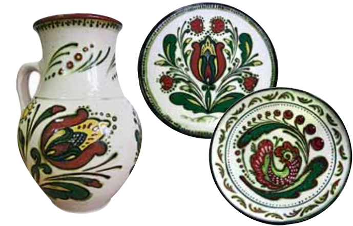
Керамічний посуд. Автор Ярослава Спасьонова. Ceramic tableware by Yaroslava Spasyonova.

Гончарі зарубинецької культури вперше в історії вітчизняної кераміки застосували дві техніки декорування виробів — лощення та задимлення. Лощення — полірування ще не зовсім висушеної поверхні виробу гладеньким камінчиком або кісткою. Після лощення поверхня посудини стає щільною, вологостійкою і набуває вишуканого блискучого вигляду. Задимлення — своєрідне «копчення» виробу в горні без доступу кисню. Після такого випалювання первісний колір його