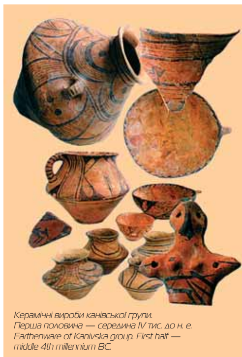
Керамічні вироби канівської групи. Перша половина — середина IV тис. до н. е. Earthenware of Kanivska group. First half — middle 4th millennium BC.