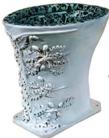
Керамічний унітаз 1883 р. Автор невідомий. Музей керамічної плитки та сантехніки, м. Харків. A ceramic toilet bowl. 1883. Author unknown. Museum of Ceramic Tiles and Sanitary Ware, Kharkiv.

художник-кераміст, член Національної спілки художників України, член Національної спілки майстрів народного мистецтва України