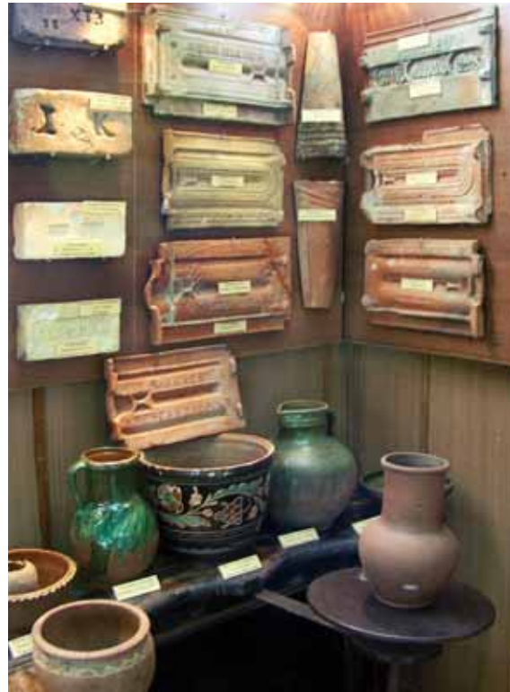
Експозиція музею керамічної плитки та сантехніки, м. Харків. Exposition of the Museum of Ceramic Tiles and Sanitary Ware, Kharkiv.

The Ukrainian counterpart for the plinfа is the word zodchy . The word zodchy traces the remembrance of the architectural meaning of clay, and consequently the brick. Clay is the earth itself. The soil is fatty, and on a rainy day it gets sticky, slippery, glue like or gleika . The Ukrainian word glyna ("clay") derives from the word gley that is "gluey earth." In those distant times both theses words had in the Church Slavonic language, which was used as literary language at that time, their equivalent — "зѣдъ" (which can be transliterated into English as "zd"). Thus, adjectives glynyany and zdany are synonyms that are having the same meaning as adjective clay . Since architects or builders of the Kyivan-Rus-Ukraine used in their work clay bricks they were