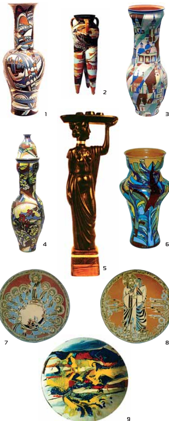
1. Ваза «Рожева фантазія». 1994. Майоліка, литво, емалі, позолота. h 86,6. 2. Ваза «Стикість. Триєдність». 1998. Майоліка, гончарне коло, емалі. h 86,5. Знаходиться в приватній колекції в Мюнхені. 3. Ваза «Старий Львів». 2002. Майоліка, гончарне коло, флюсований ангоб. h 88. 4. Ваза «Дерева в полі». 2003. Майоліка, гончарне коло, флюсований ангоб, глазур, авторська техніка. h 93. 5. Пластика «Олімпія. Виноносиця». 1985. Майоліка, полива, дерево, посріблення. 46x8x16. 6. Ваза «Весняний ліс». 2000. Майоліка, гончарне коло, емалі, позолота. h 62. 7. Таріль «Остання рада (Тайна вечеря)». 1995. Майоліка, розпис, ритування. 8. Таріль «Поцілунок Юди». 1994. Майоліка розпис ритування. 9. Таріль «Підводний мотив». 1999. Майоліка, поливи, смальта, ангоби.

Since 1990 I.M. Khoda has worked at Lviv National Academy of Arts at the Department of Art Ceramics and he gives his knowledges and skills to younger generations.