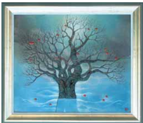
◀ Стара яблуня Крехівського монастиря. Гаряча емаль, 35x40. 2009 ▼ Кольє. Топаз, сапфіри, діаманти, золото, емаль, 15x18. 2005