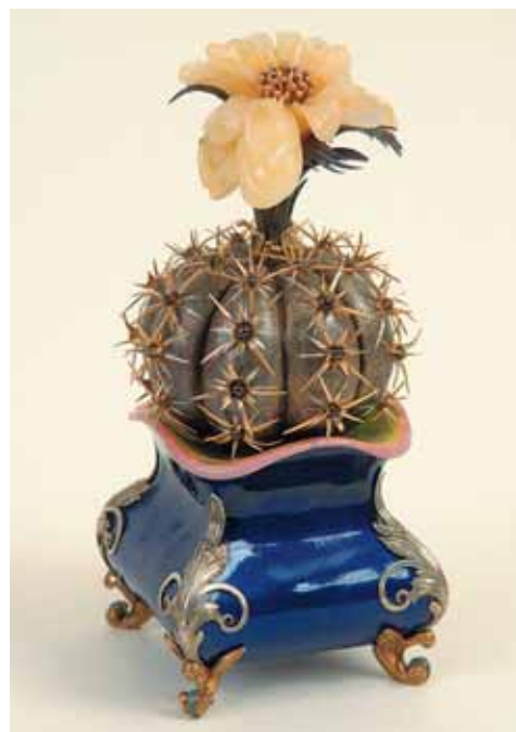
▲ Кактус IV. Срібло, золото, агат, діаманти, гаряча емаль, 17x7x7. 2001