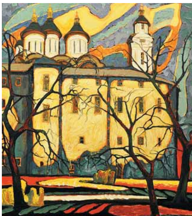
▲ Успенська церква (Астрахань). Полотно, олія, 72x85. 2003