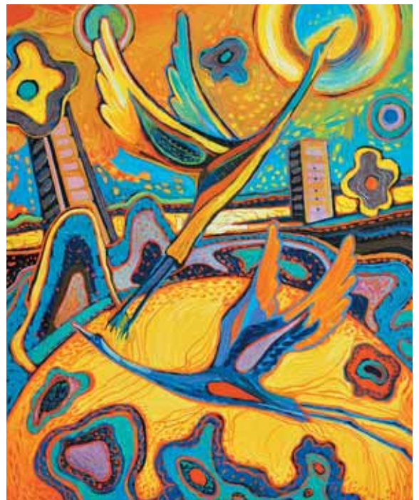
▲ Воля. Полотно, олія, 90х110. 2003