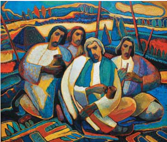
▲ Подорожні. Полотно, олія, 110х130. 2003

Доцент кафедри академічного живопису ЛНАМ. Директор музею-заповідника «Личаківський цвинтар». Заслужений діяч мистецтв України. Член Національної спілки художників України