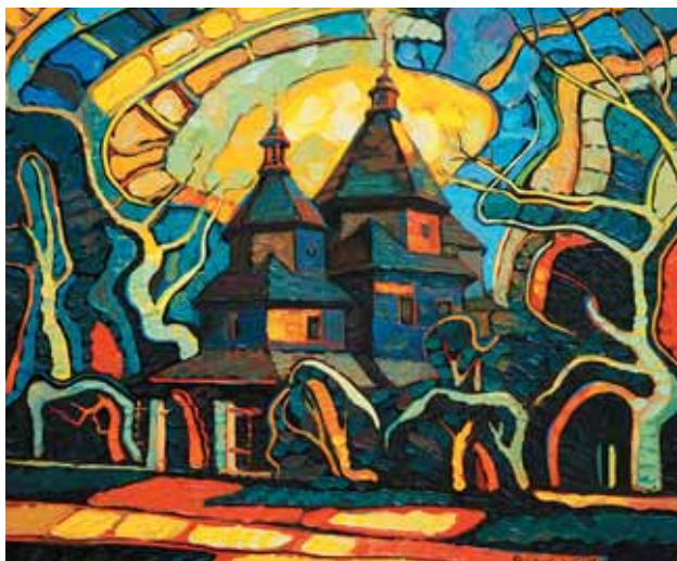
▲ Ранкове пробудження. Полотно, олія, 85x72. 2009