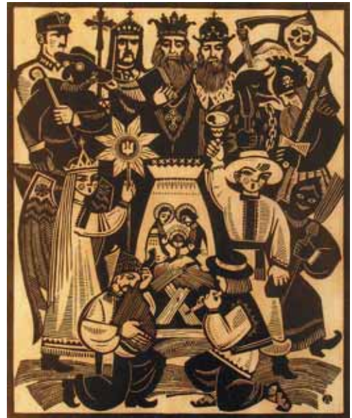
▲ Вертеп «Возвеселімся всі купно нині...». Із серії «Народні традиції». Папір, ліногравюра, 30x24. 1992

Народився 1 квітня 1931 р. у с. Черкаси Пустомитівського району на Львівщині.