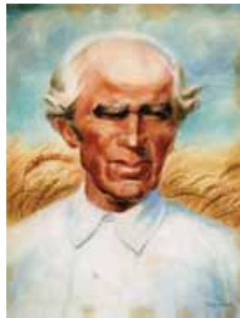
▲ Ескіз декорації телевистави «Сестри Річинські». 1966 ▲ Батько. Із серії «Їхні руки пахнуть хлібом». Папір, акварель, 40x30. 1980