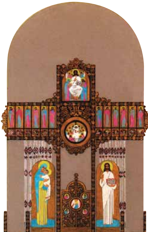
▲ Проект іконостаса для церкви у с. Черкаси на Львівщині. Картон, туш, темпера, бронза, 41x26. 1998