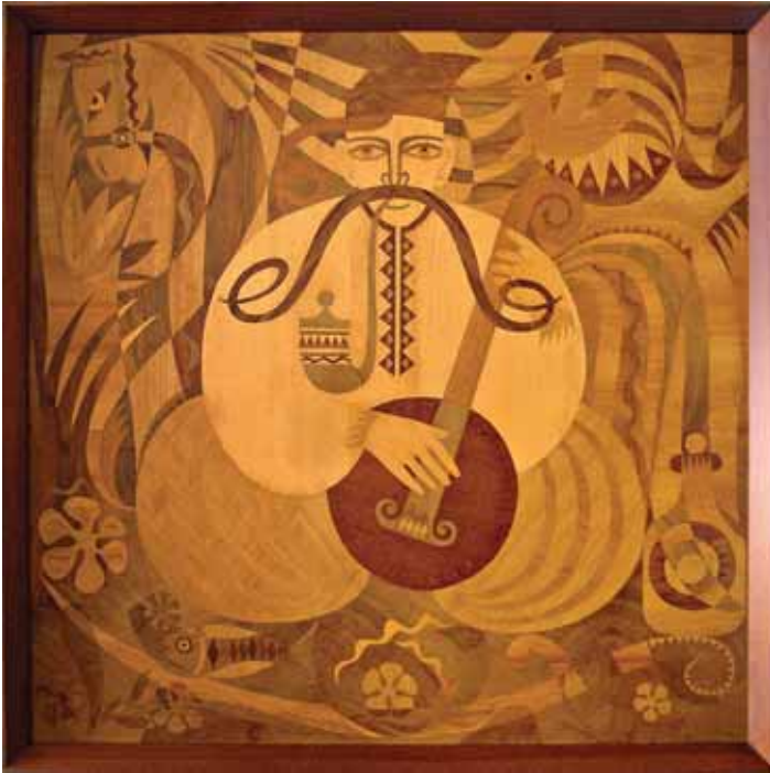
▲ Декоративне панно «Козак Мамай». Дерево, інтарсія, 100х100. 1990

Професор кафедри інтер'єру Львівської національної академії мистецтв. Член Спілки дизайнерів України