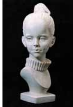
◀ Материнська душа. Алюміній, бронза, 47х18х15. 1999 ◀ Вікуська. Штучний мармур, 50х20х18. 2009 ▶ Сон. Дерево, чавун. 87х70х33. 1989