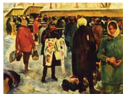
▲ Базар. Косів. Папір, пастель, 50x71. 1973

Народився 25 вересня 1927 р. у с. Нова-Сотня Острозького району Воронежської області.