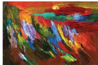
▲ Пейзаж. Олія, картон, 22x32. 1999