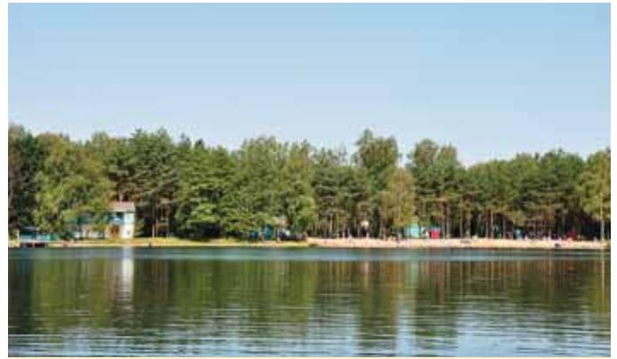
Спортивно-оздоровчий табір «Медик»

складається з чотирьох їдалень та п'яти буфетів. До послуг студентів і викладачів — спортивно-оздоровчий табір «Медик», що розташований на мальовничому березі озера Пісочне у селищі Шацьк на Волині.