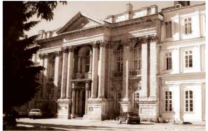
Львівська обласна клінічна лікарня — база низки клінічних кафедр університету

На факультетах медико-профілактичного спрямування організовані кафедри пропедевтичної, факультетської, шпитальної терапії; пропедевтичної, факультетської,