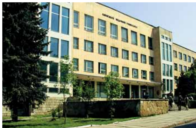
Теоретичний корпус ЛНМУ імені Данила Галицького

Львівський національний медичний університет імені Данила Галицького — один із найстаріших і найбільших