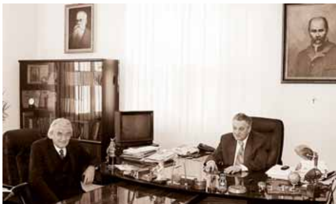
Візит почесного доктора ЛНМУ, міністра охорони здоров'я Республіки Польща, професора Збігнева Релігі до ректора, професора Бориса Зіменковського