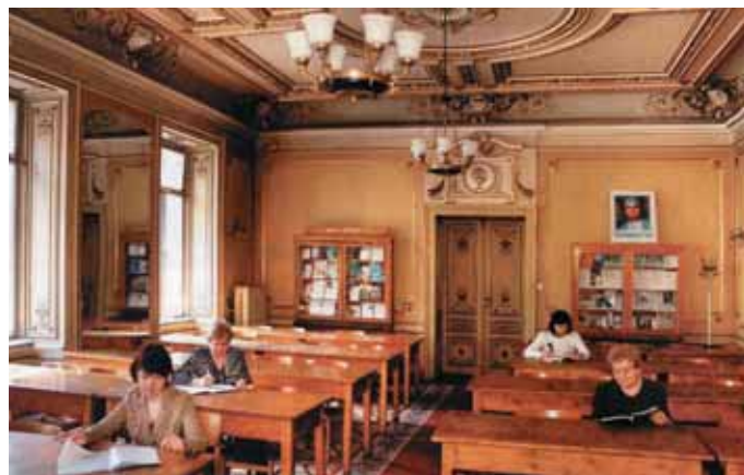
Інтер'єр читального залу наукової бібліотеки ЛНМУ