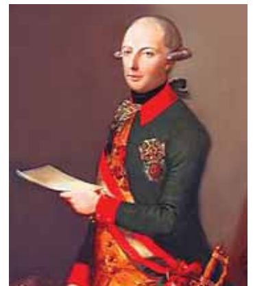
Йозеф II Габсбург (1741–1790), імператор Священної Римської імперії

У 1805 р. через геополітичні зміни, зумовлені Наполеонівськими війнами, Львівський університет було перенесено до Кракова, але у приміщеннях медичного факультету продовжував функціонувати Медико-хірургічний інститут, який, однак, не надавав титулу доктора медицини, а лише магістра хірургії та акушерства. Варто зауважити, що привілеєм надавати титул доктора медицини на той час користувався тільки столичний Віденський університет. Для отримання цього звання після завершення шестирічного навчання, наприклад, у Львові, Будапешті чи Празі, потрібно було пройти однорічне стажування у Відні та захистити там дисертаційну працю.