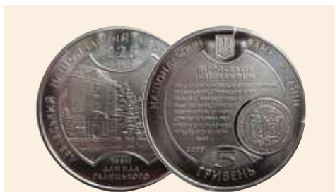
Пам'ятна монета, присвячена 225-й річниці створення університету

Розбудова нашої держави неможлива без подальшого розвитку національної освіти, науки і культури. Для цього необхідні висококваліфіковані та національно свідомі молоді фахівці, формуванням яких займається вища школа. Львівський національний медичний університет імені Данила Галицького, пройшовши складний історичний шлях свого становлення, гідно виконує цю високу місію і по праву посідає одне з провідних місць серед вищих медичних навчальних закладів України.