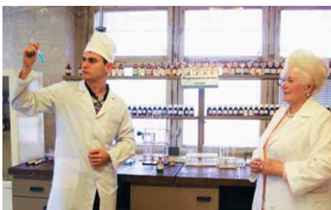
Лабораторне заняття студентів фармацевтичного факультету

змінювалася: медичний факультет Львівського Йозефінського університету (1784–1805); Медико-хірургічний інститут (1805–1875), фармацевтичне відділення філософського факультету (1854–1919), медичний факультет (1894–1919) Львівського університету імені Франца І; медичний факультет Львівського університету Яна Казімежа (1920–1939); Львівський державний медичний інститут (1939–1941, 1944–1984); Державні медико-природничі фахові курси у Львові (1942–1944); Львівський орден Дружби народів державний медичний інститут (1984–1996); Львівський державний медичний університет (1996–1998); Львівський державний медичний університет імені Данила Галицького (1998–2003); Львівський національний медичний університет імені Данила Галицького (з 2003 р.).