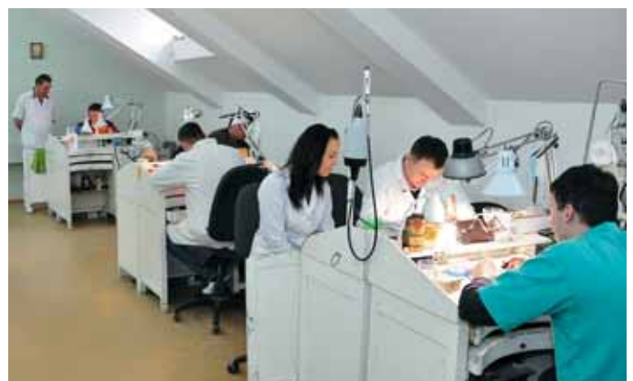
Практичне заняття у Стоматологічному медичному центрі