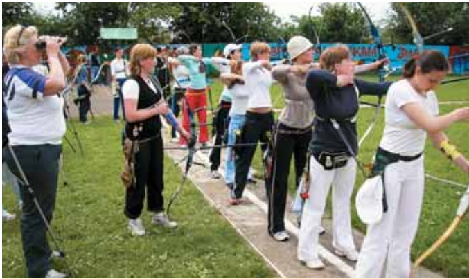
Заняття зі стрільби з лука