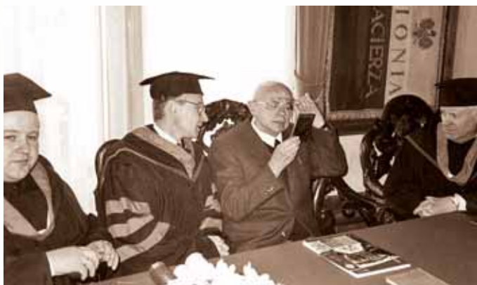
Інавгурація Станіслава Лема як почесного доктора ЛНМУ