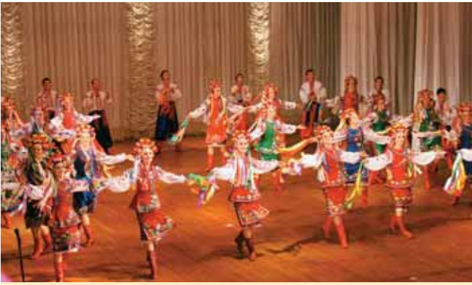
Виступ народного танцювального ансамблю «Горицвіт» у Львівському оперному театрі імені Соломії Крушельницької

ЛНМУ імені Данила Галицького проводить активну міжнародну діяльність, спрямовану на вивчення та впровадження найкращого світового досвіду в галузі вищої медичної і фармацевтичної освіти та науки. Викладачі і науковці беруть участь у міжнародних конгресах, симпозиумах, проходять наукові стажування тощо. Щорічно підвищують свій професійний рівень близько 120 працівників університету, з них 10–20 — за кордоном.