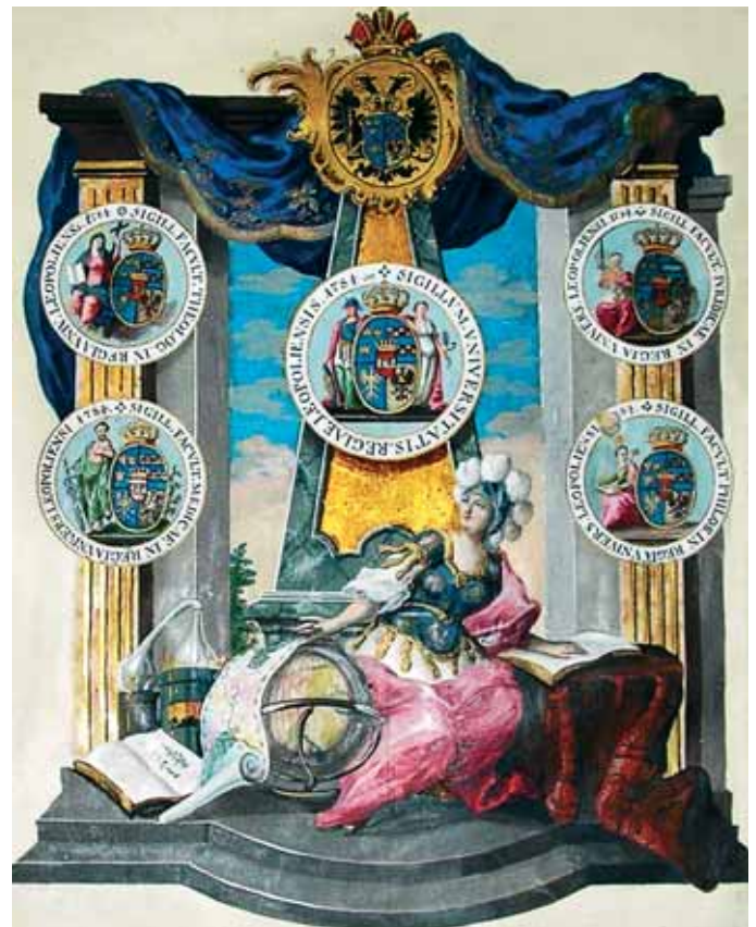
Історичні герби Львівського університету та його чотирьох факультетів (1784)

Урочисте відкриття медичного факультету у складі відновленого згідно з патентом Імператора Йозефа II Львівського університету відбулося 16 листопада 1784 р.