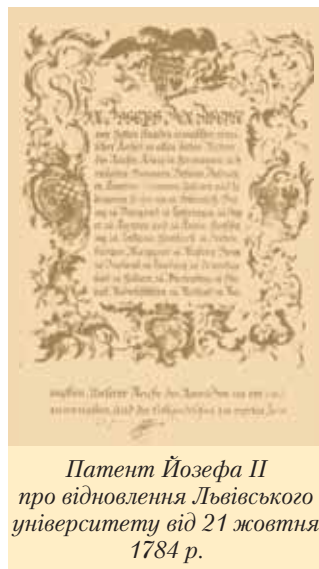
Патент Йозефа II про відновлення Львівського університету від 21 жовтня 1784 р.