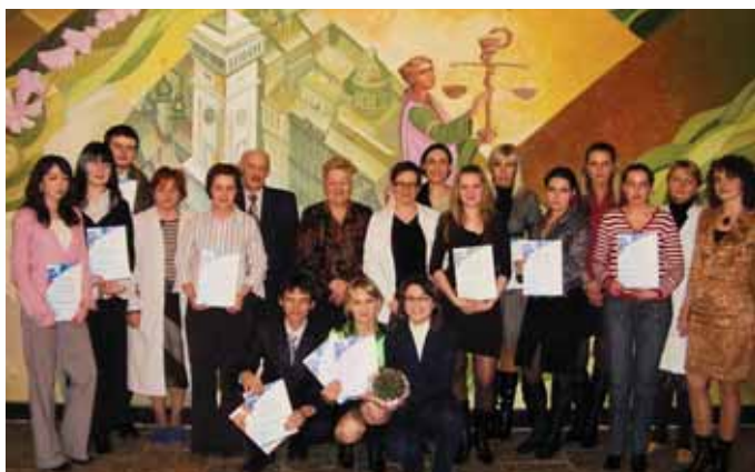
Конференція студентів фармацевтичного факультету