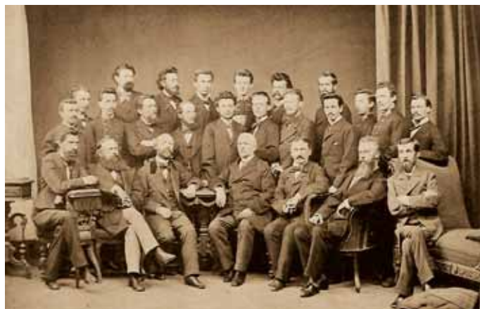
Професори та випускники фармацевтичного відділення Львівського університету, 1878 р.

9 вересня 1894 р., відповідно до Імператорського патенту від 25 жовтня 1891 р., у складі Львівського університету відбулося відновлення медичного факультету.