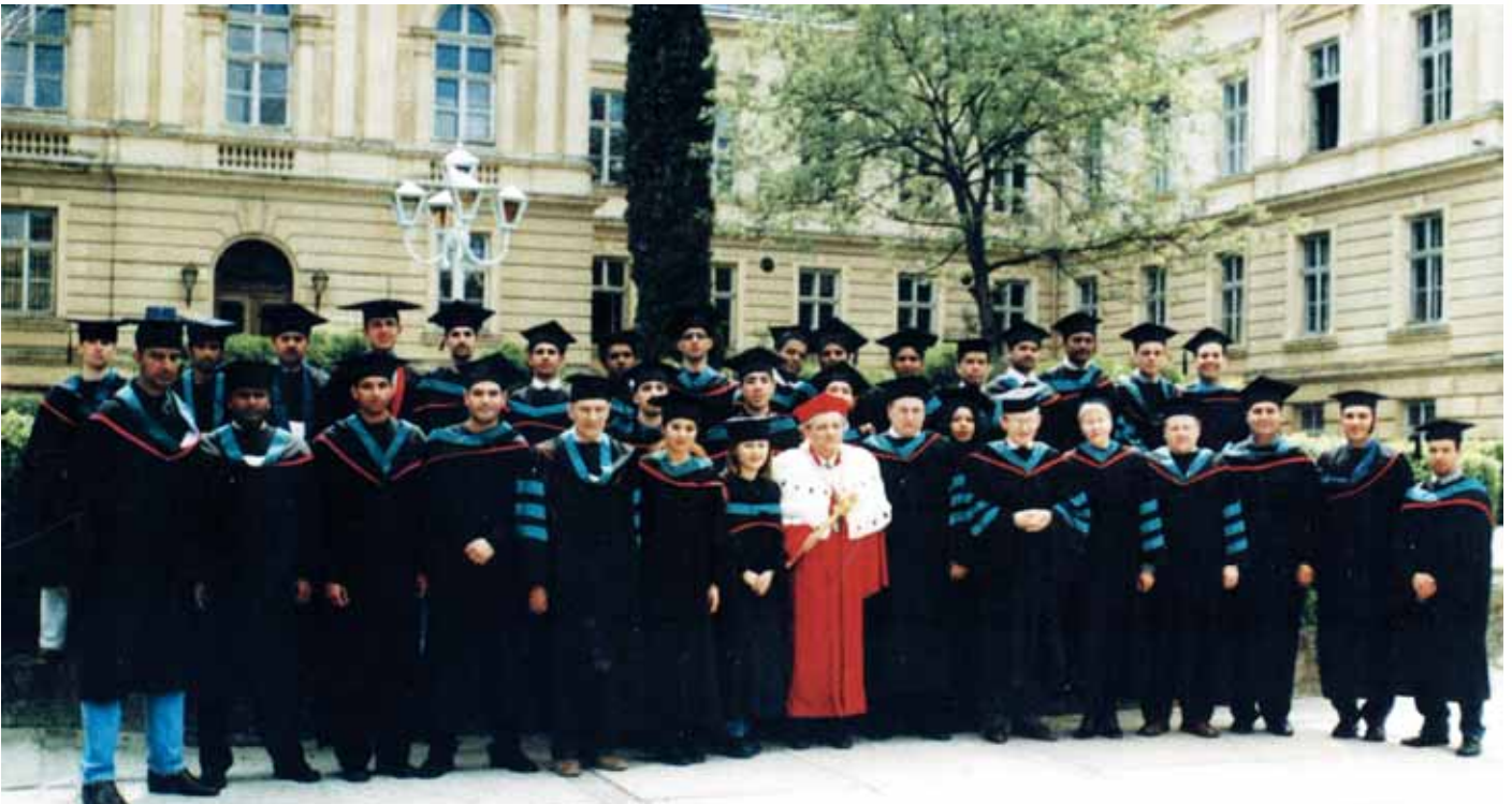
Ректор Університету професор Борис Зіменковський із випускниками, 2000 р.

вання хвороб пародонту; вивчення впливу чинників довкілля на організм та особливості терапії неінфекційних й інфекційних хвороб; основні хвороби матері і дитини; діагностика та лікування уражень головного мозку різного генезу; дослідження психологічних, соціальних, фармакологічних факторів реабілітації психічно хворих і значення нозогенних реакцій у структурі психічних захворювань; організація й управління охороною здоров'я та фармацевтичною забезпеченістю населення.