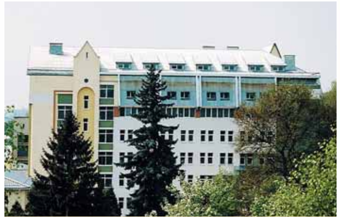
Новозбудований корпус Стоматологічного медичного центру – база профільних кафедр стоматологічного факультету

Окремими структурними підрозділами університету є: – Медичний коледж (створений у 2009 р.), який замінив факультет вищої медсестринської освіти, що функціонував при навчальному закладі упродовж 1996–2005 рр.;