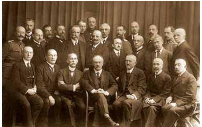
Професори медичного факультету Львівського університету, 1920 р.

Після розпаду Австро-Угорської імперії і українсько-польської війни (1919–1920), у 1921 р. Львівському університетові було передано приміщення Галицького крайового сейму. У цій будівлі деякий час розміщувався деканат медичного факультету, куди абітурієнти подавали документи для зарахування до навчального закладу. Дещо пізніше, у 1938 р., граф Станіслав Бадені офірував у дар університету власний будинок із великою книгозбірнею (нинішня адреса — вул. Січових Стрільців, 6). Там тепер розташовується наукова бібліотека ЛНМУ імені Данила Галицького.