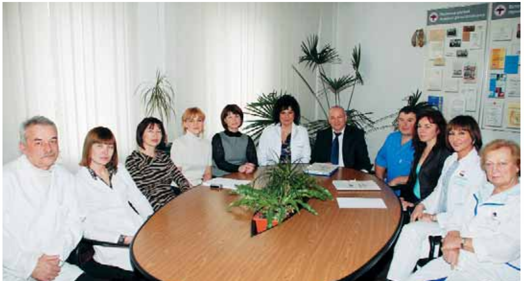
Колектив Рівненської філії кафедри терапії №1 та медичної діагностики

– удосконалення методів лапароскопічних оперативних втручань на жовчних шляхах. Вивчення