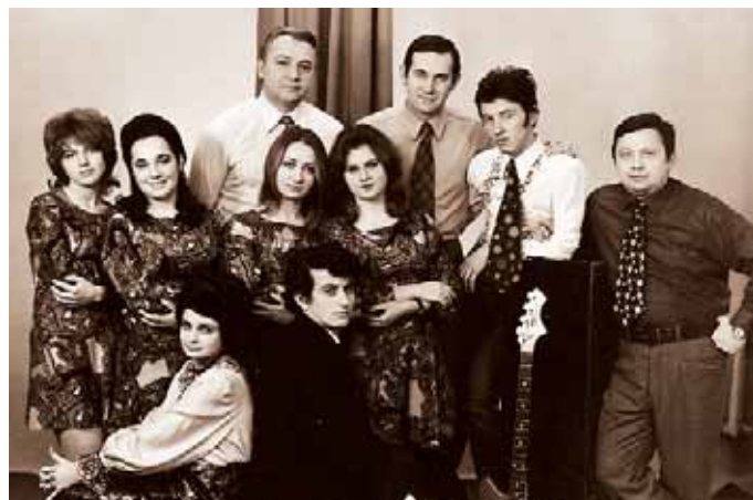
Ансамбль «Медикус» із вокальною групою (70-ті рр. ХХ ст.)