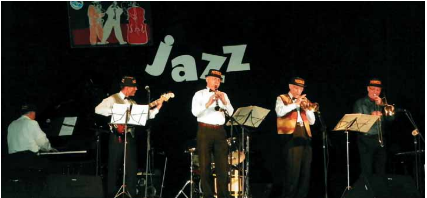
Виступ на IV Європейському фестивалі традиційної джазової музики. Польща, Познань, 2012 р.

свят, міжнародних симпозіумів і конференцій, зокрема, тих, які відбуваються у ЛНМУ імені Данила Галицького, а також відомих джазових форумів, серед яких «Флюгери Львова», «JazzBez». Колектив виступає з концертними програмами на різних заходах, які проводяться у Львові, — до Дня міста, Міжнародного книжкового форуму видавців, а також на фестивалях пива, шоколаду тощо.