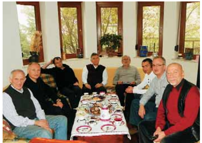
Колектив Народного естрадного ансамблю «Медікус»

Творчість Народного естрадного ансамблю «Медікус» завжди вражала високим професіоналізмом. Хоча його учасниками не є професійні музиканти, але вони дуже талановиті та люблять свою справу.