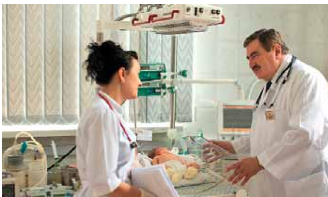
Під час огляду

У вільний час любить грати у волейбол. Але його найбільше хобі — відпочинок із сім'єю.