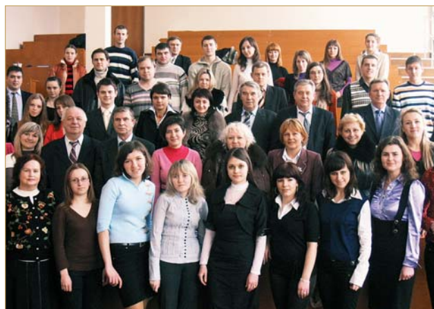
Викладачі кафедри серед учасників конференції — аспірантів, пошукувачів та магістрів, 26 лютого 2009 р.

Результати фундаментальних та прикладних досліджень опубліковані в наукових виданнях. Завідувач кафедри, проф. А. Г. Загородній є автором понад 500 друкованих праць, з них шести монографій, двох підручників, понад