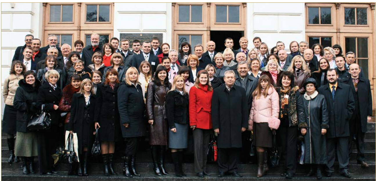
Учасники конференції «Обліково-аналітичне забезпечення системи менеджменту підприємства» 23–24 жовтня 2009 р.

За період 2002–2009 рр. кафедра обліку та аналізу організувала три науково-практичні конференції. 26–27 листопада 2004 року проведена науково-практична