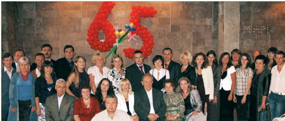
На засіданні кафедри менеджменту організації, присвяченому 65-й річниці її заснування, вересень 2009 р.

«Шляхи удосконалення заготівельної бази машинобудування».