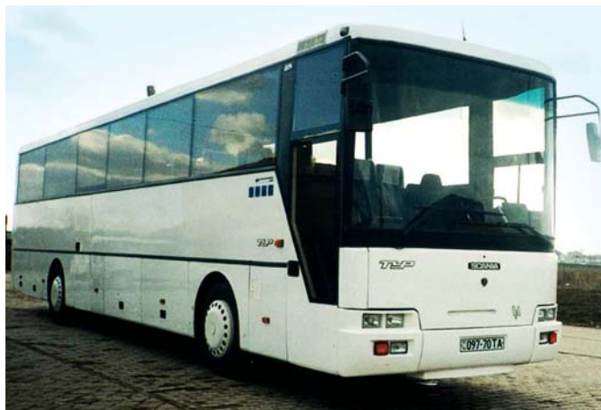
ТУР А-174 на шасі Scania