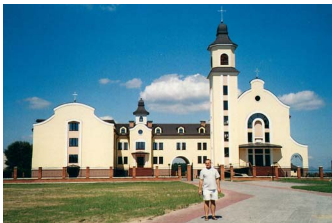
Костьол із чоловічим монастирем у м. Обухові Київської області