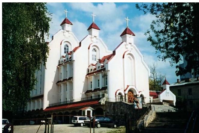
Церква Заповіту Ісуса Христа в Житомирі