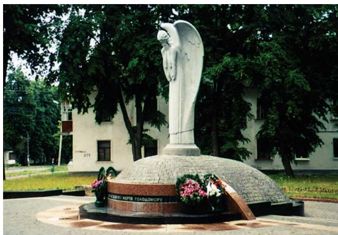
Пам'ятник жертвам Голодомору 1932–1933 рр. у Житомирі