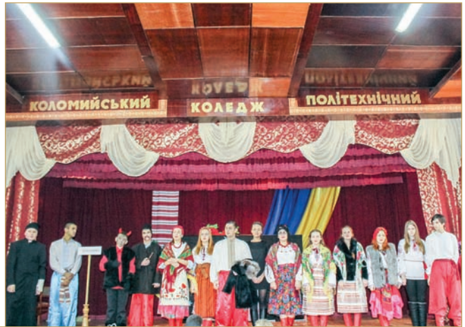
Танцювальний колектив «Аркан»