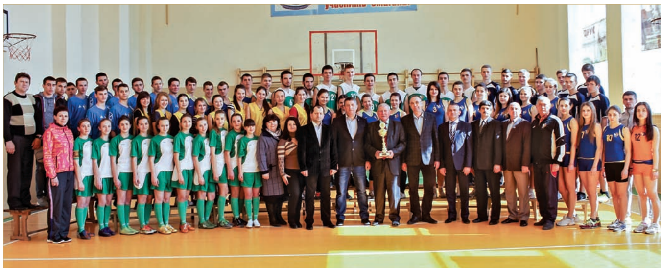
Коломийський політехнічний коледж НУ «Львівська політехніка» — переможець Всеукраїнського огляду-конкурсу на кращий стан фізичного виховання серед ВНЗ I–II рівнів акредитації за 2013–2014 н. р.

Фундаментом практичного навчання є навчально-виробнича база коледжу. До її складу входять майстерні, які первинно ознайомлюють студентів із виробничими та промисловими процесами. Це дає їм змогу вже на першому році навчання краще зрозуміти своє місце та роль як майбутніх фахівців. Навчально-виробничі майстерні відповідно оснащені, і служать місцем для практичного виконання завдань, що супроводжують вивчення профільних предметів і дисциплін. Майстерні надають можливість студентам проходити виробничу практику в умовах реальних місць праці.