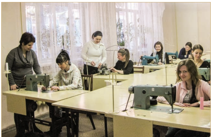
Навчальну практику проводять висококваліфіковані майстри коледжу