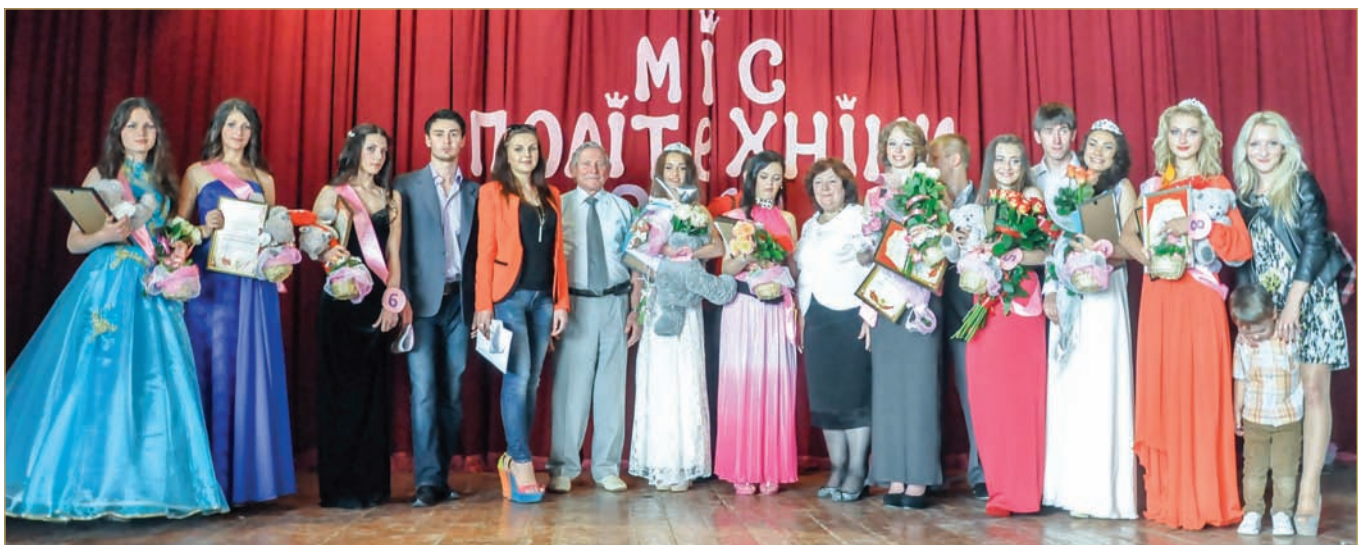
Конкурс «Міс політехніки»