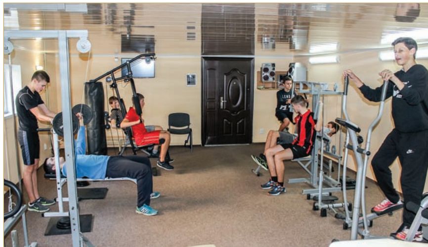
Тренажерна зала коледжу

Студенти, які навчаються на відділенні комп'ютерних технологій, отримують знання з основ алгоритмізації та програмування. Вивчають HTML, CSS, C++, C#, PHP, Java