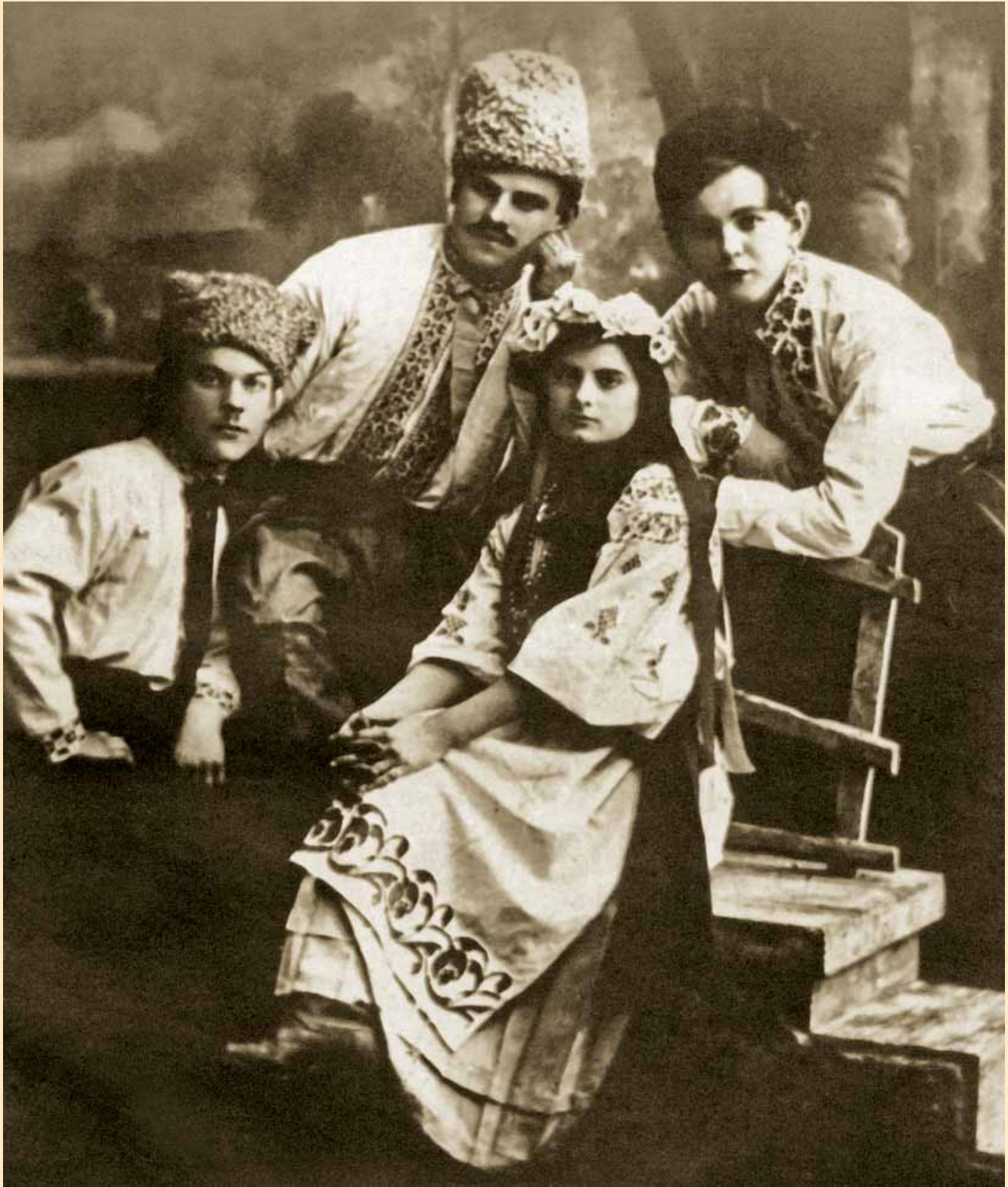
Одні з перших студентів технікуму — артисти художньої самодіяльності, 1925 р.