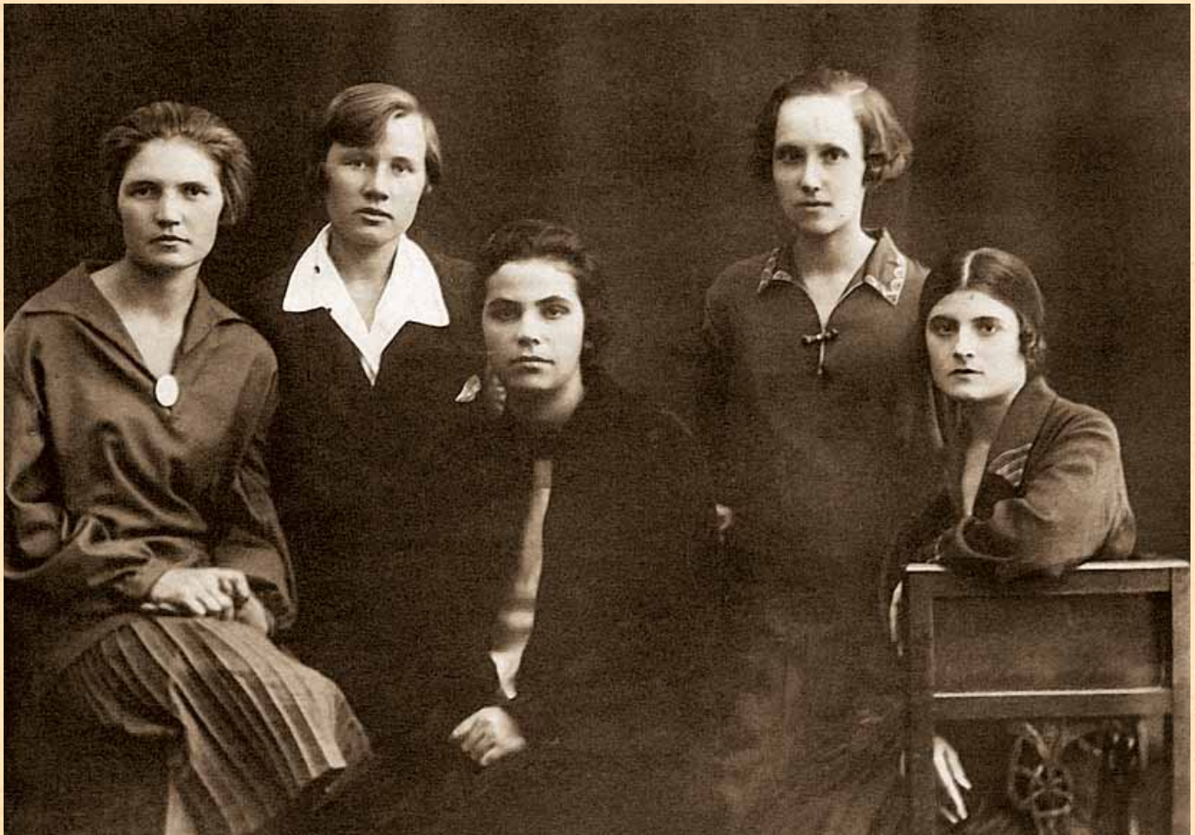
Учасники драматичного гуртка, 1926 р.