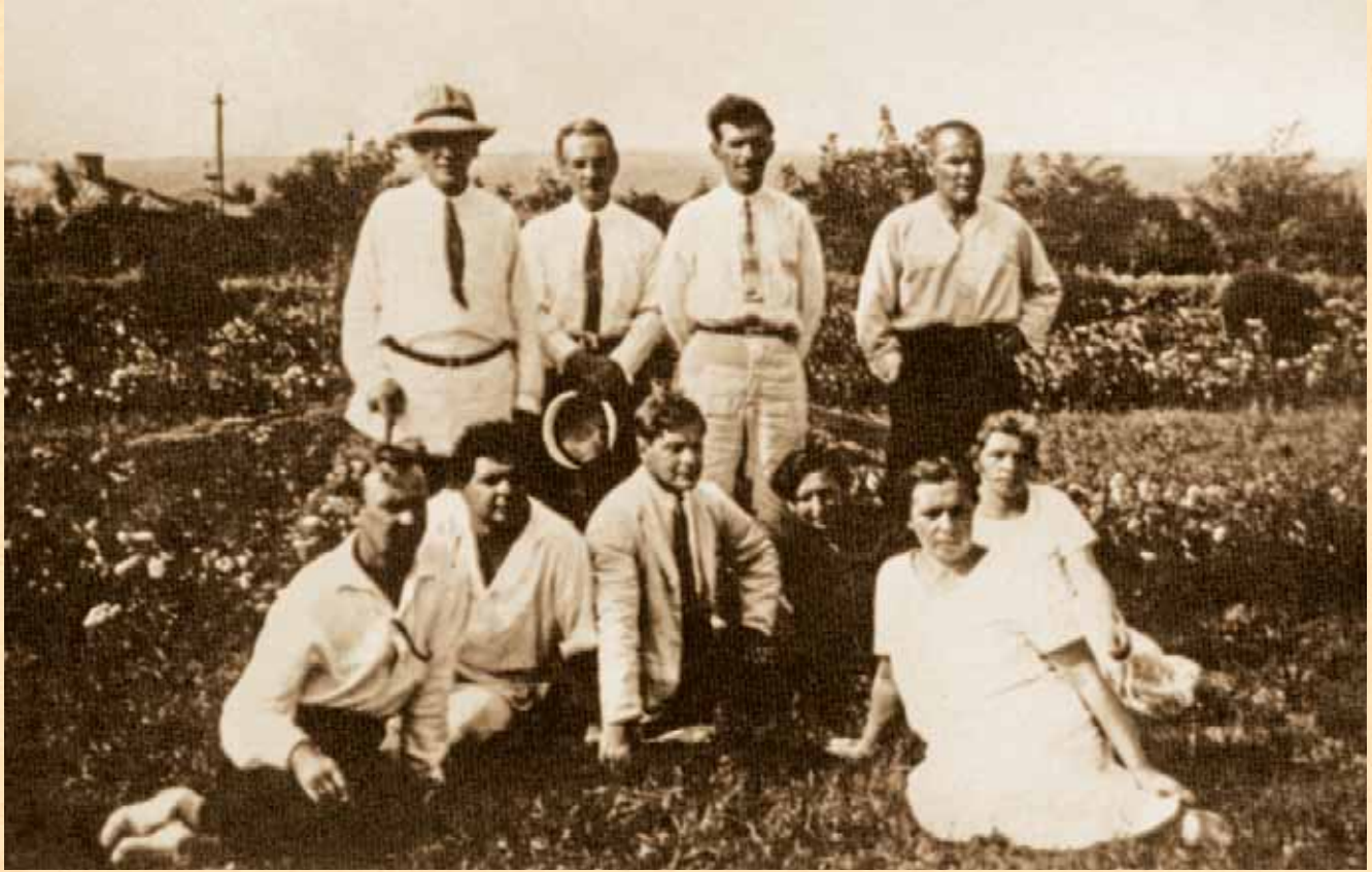
Викладачі й співробітники Луганського технікуму рільництва на відпочинку, 1924 р.