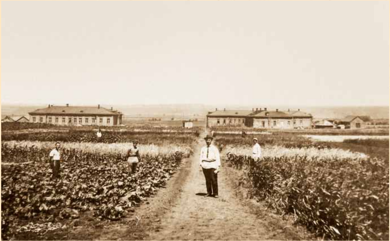
Дослідне поле, 1924 р.