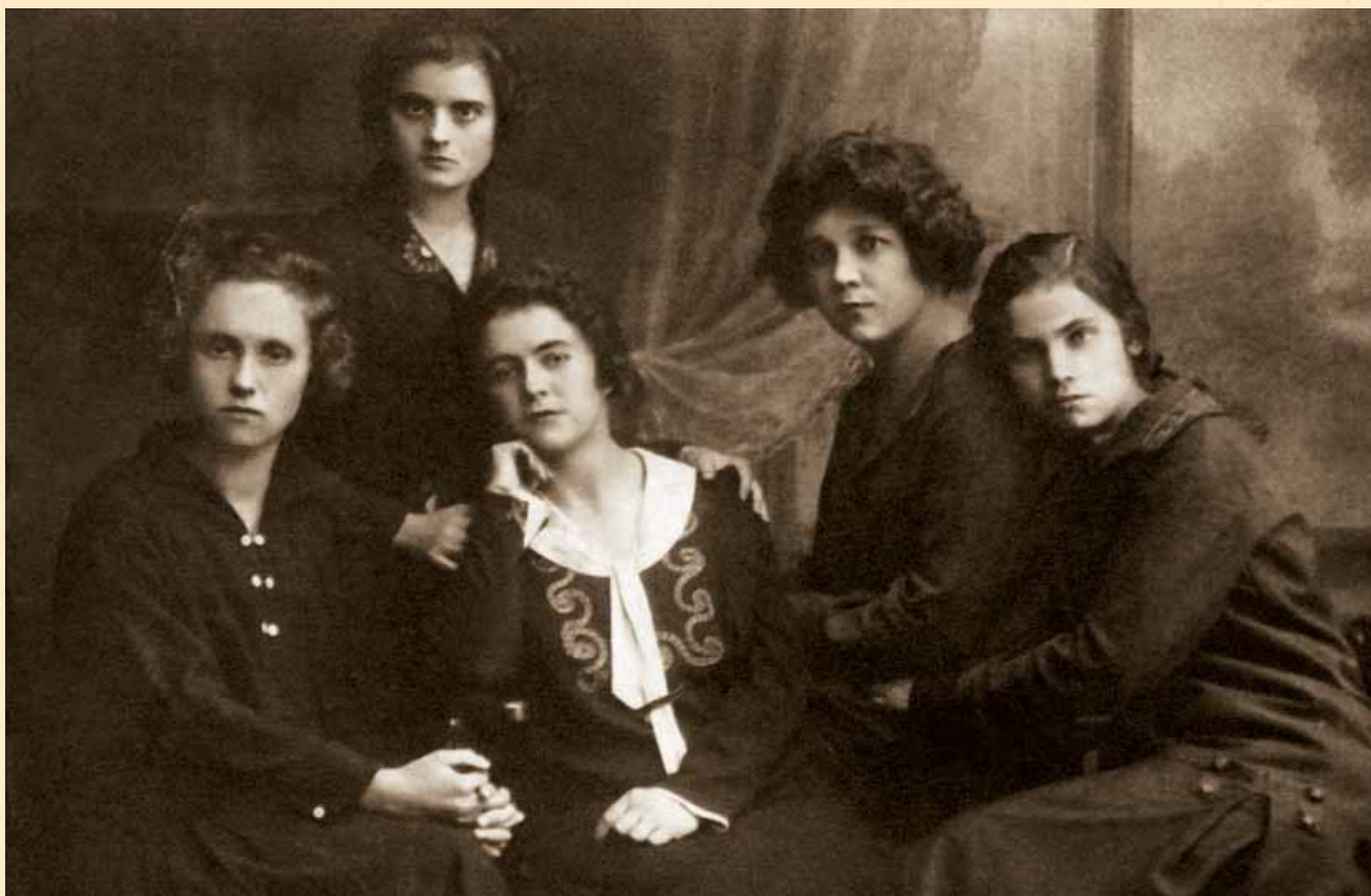
Навчання і творчість — основа гармонійного розвитку: студенти й артисти — в одній особі, 1925 р.