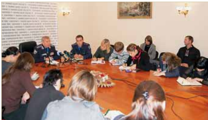
Василь Пісний на прес-конференції

За багаторічну і бездоганну службу в органах внутрішніх справ, сумлінне ставлення до виконання службових обов'язків генерал-лейтенант міліції В. М. Пісний нагороджений відзнаками МВС України «За відзнаку в службі» II, I ступеня (2001, 2003), «Почесний знак МВС України» (2005), «Лицар закону» (2006), «Почесна відзнака ГУБОЗ МВС України» II ступеня (2006), «За безпеку народу» II ступеня (2006), «За протидію дитячій злочинності» II ступеня (2006). За вагомий внесок у справу боротьби зі злочинністю, досягнення успіхів