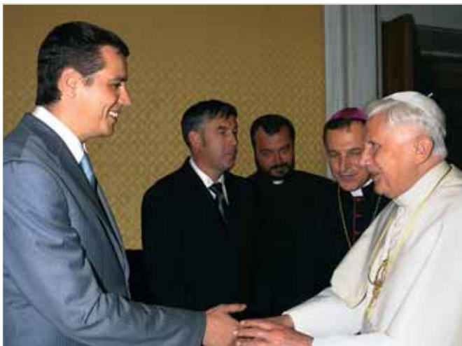
На особистому прийомі у Папи Римського Бенедикта XVI. Ватикан, червень 2009 р.

Завжди з приємністю зустрічається Володимир зі своїми колишніми однокурсниками, друзями, яких подарувала пора студентства. Приїжджаючи до Львова, завжди намагається завітати до стін рідного юридичного факультету на вулиці Січових Стрільців, поринути у спогади про ті незабутні часи. Згадуються зимові поїздки