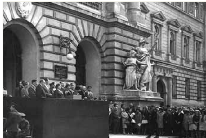
Посвячення у студенти (1966 р.)