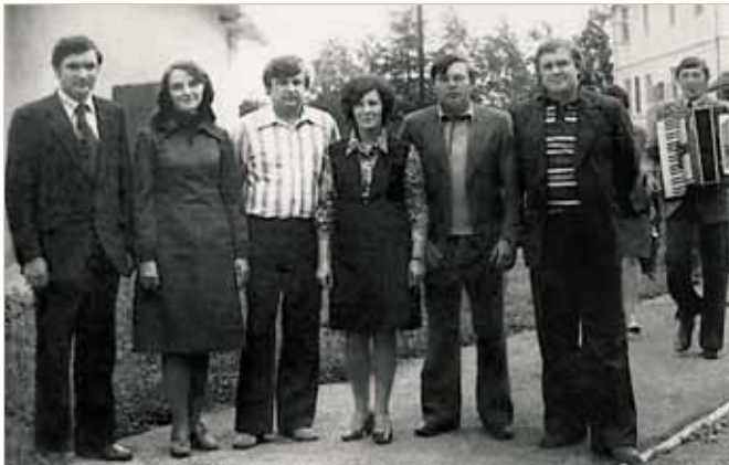
У колі студентських друзів

Сьогодні академік О. О. Погрібний є одним із найвідоміших в Україні та за її межами фахівців із цивільного, аграрного, земельного, екологічного та природоресурсного права, засновником відповідної наукової школи. Під його керівництвом захищено 20 кандидатських дисертацій, він є автором понад 200 наукових праць, зокрема 22 індивідуальних