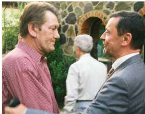
Зустріч із Президентом України Віктором Ющенком, 2006 р.

Протягом 1985–2000 рр. обіймав посаду головного редактора міжвузівського наукового збірника «Геологія метаморфічних комплексів». Сьогодні займається здебільшого проблемами фізики природних процесів.