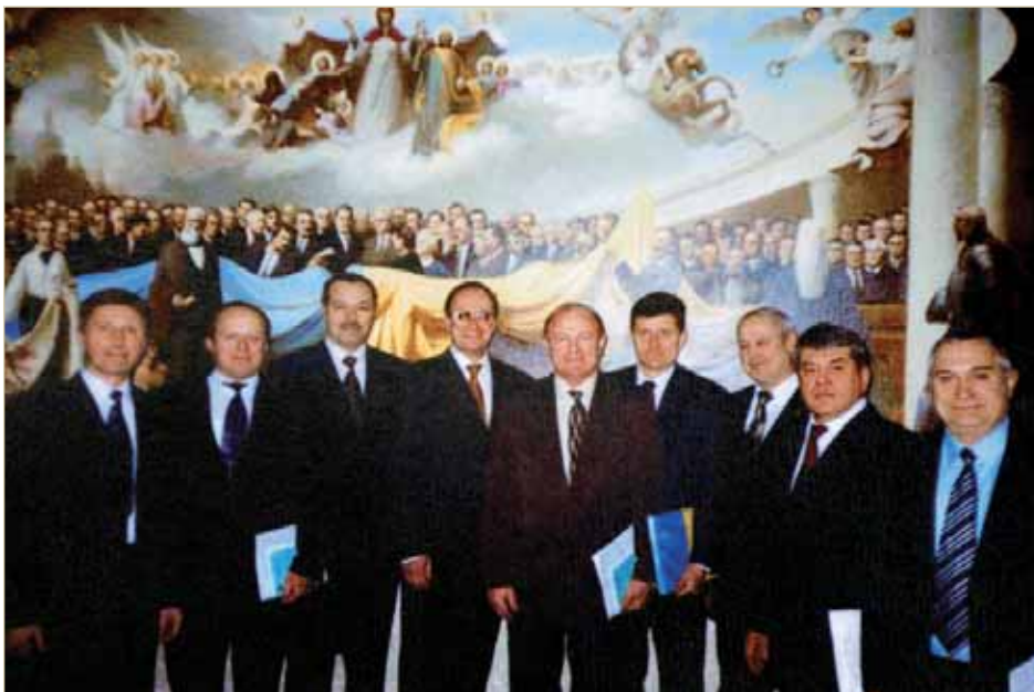
Після прийняття Верховною Радою постанови про призначення суддів Вищого адміністративного суду України (перші 9 суддів), 11 грудня 2003 р.