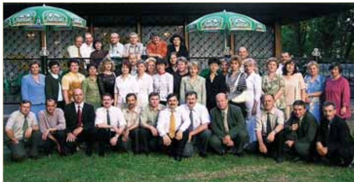
Зустріч випускників фізичного факультету через 20 років, 2004 р.

Нагороджений медаллю Національної академії наук України (1998 р.), Почесною грамотою Верховної Ради України (2005 р.), Почесною нагородою «Лицар Вітчизни» Асамблеї ділових кіл (2009 р.), відзнакою Національної академії наук України за професійні здобутки (2009 р.).