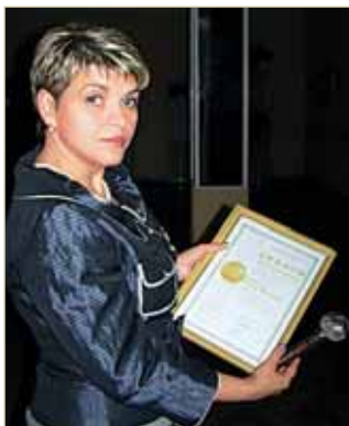
Відзнака за вагомий внесок у розвиток будівельної галузі України