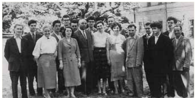
Група геохіміків геологічного факультету Львівського державного університету імені Івана Франка зі своїми вчителями після вручення дипломів про закінчення університету. Львів, 1960