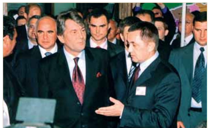
Міжнародний економічний форум, м. Львів, 2005 р.