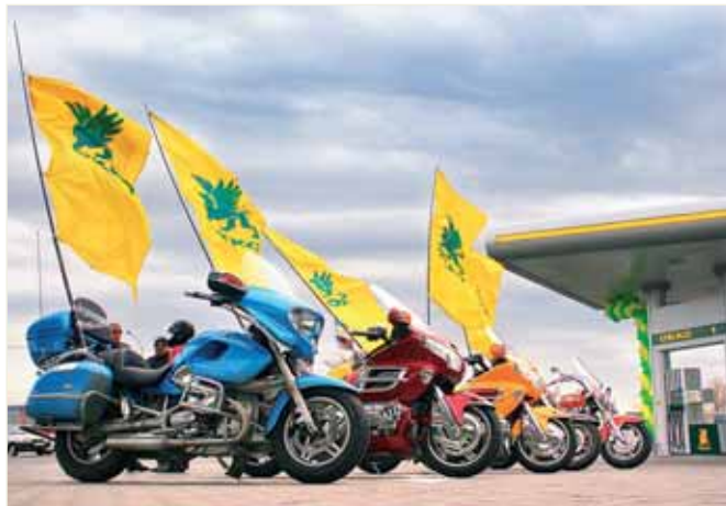
Під час відкриття Зльоту байкерів, що проходив на Закарпатті за спонсорської підтримки Компанії «Галнафтогаз»

1990 р. закінчив з відзнакою середню школу та вступив на економічний факультет Львівського державного університету імені Івана Франка (спеціальність «Економічна кібернетика»). Протягом 1995–1999 рр. навчався на правничому факультеті того ж університету і водночас працював на різних посадах у підрозділах обласної державної податкової служби.