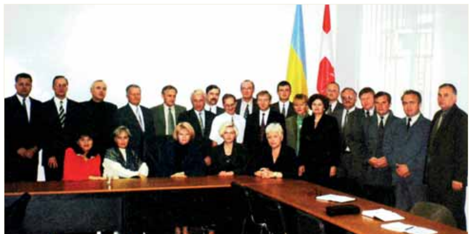
Зустріч слухачів курсів підвищення кваліфікації працівників юстиції України з Державним секретарем Міністерства юстиції України Олександром Лавриновичем та його заступником Олександром Пасеноком, вересень 2003 р.

У житті, вважає він, потрібно бути працелюбним, лише наполегливістю і завзятістю можна досягти відмінних результатів.