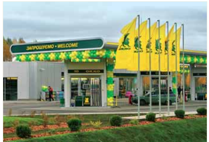
АЗК ОККО в Калинівці під Києвом