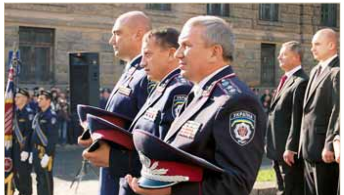
Прийняття присяги курсантами Львівського державного університету внутрішніх справ