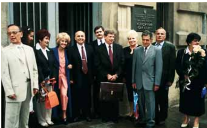
Зустріч випускників факультету 1972 року

За бездоганну службу в органах прокуратури мала 37 заохочень, нагороджена нагрудними знаками «Почесний