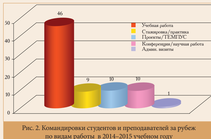
Рис. 2. Командировки студентов и преподавателей за рубеж по видам работы в 2014–2015 учебном году

На рис. 2 представлена статистика касательно количества командировок студентов и преподавателей за рубеж по видам работы. Наибольшее число зарубежных командировок в 2014–2015 учебном году было у преподавателей социально-гуманитарного (14), затем у металлургического (11) и экономического (10) факультетов.