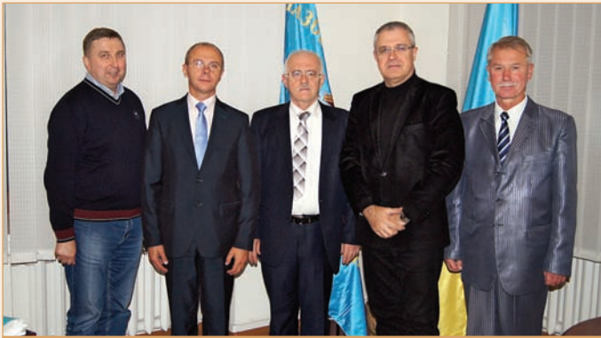
Визит европейской делегации из Польши