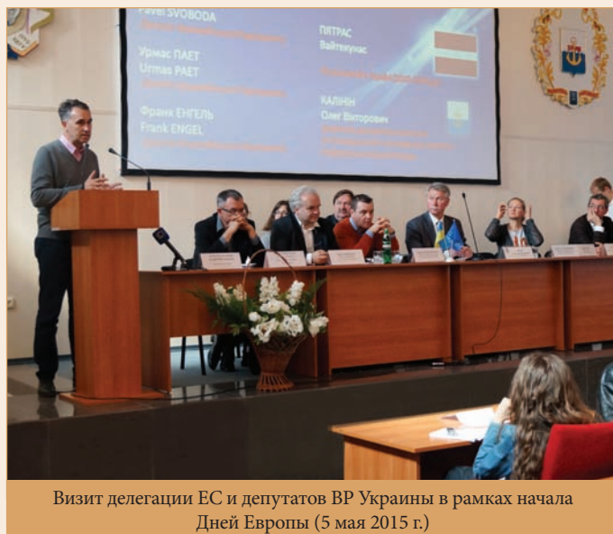
Визит делегации ЕС и депутатов ВР Украины в рамках начала Дней Европы (5 мая 2015 г.)