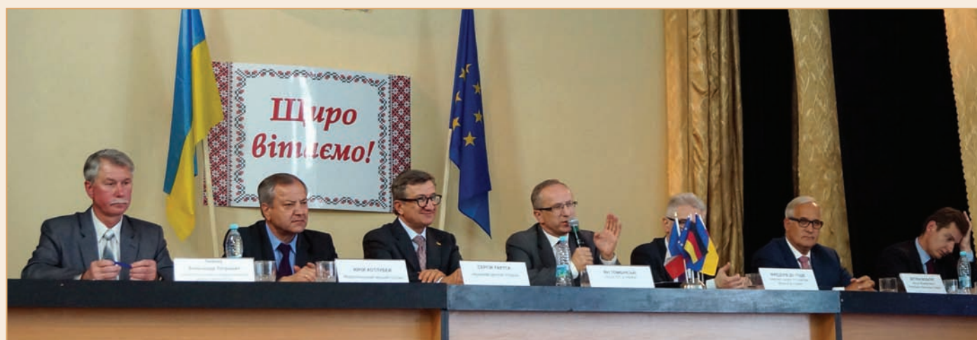
Встреча европейских дипломатов со студентами и преподавателями ПГТУ (19 мая 2015 г.)