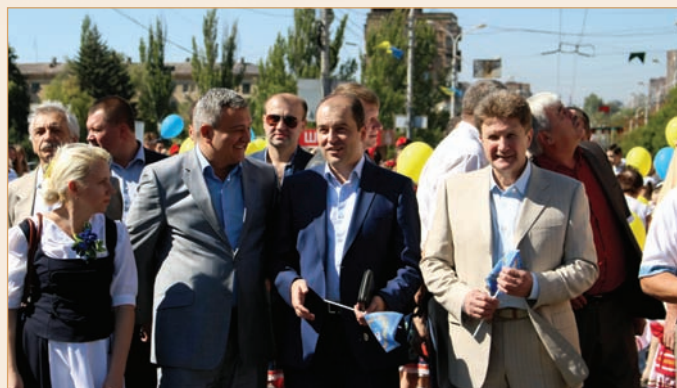
Празднование дня города, сентябрь 2015 г.