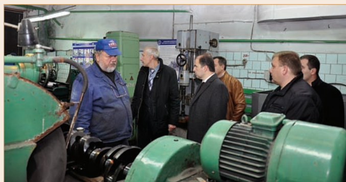
Рабочие будни: в автобазе порта