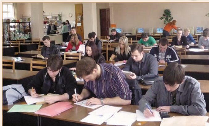
Читальный зал технических и естественных наук

инновационных форм и методов работы. В 2000–2001 гг. библиотека получила компьютеры и современное программное обеспечение. После масштабной работы по ретро-конверсии традиционных каталогов, в последующие четыре года был создан электронный каталог библиотеки ПГТУ. Для формирования более полной электронной картотеки в 2005–2006 гг. библиотека стала участником двух корпораций: российской МАРС (Межрегиональная аналитическая роспись статей) и украинской ЦУКК (Центрально-украинский корпоративный каталог). За это время существенно увеличилось количество компьютерной техники, зал каталогов предоставил возможность бесплатного пользования сетью Интернет, также электронный каталог библиотеки стал доступен удаленным пользователям.