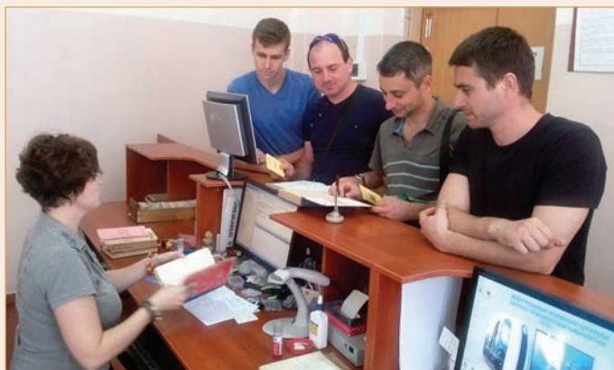
Абонемент учебной литературы