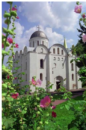
Борисоглібський собор (XII ст.)

Сучасний архітектурний ансамбль площі сформувався не одразу. На початку XIX ст. в західній її частині за проектом архітектора А. Карташевського спорудили одноповерховий міський магістрат (зараз тут обласне