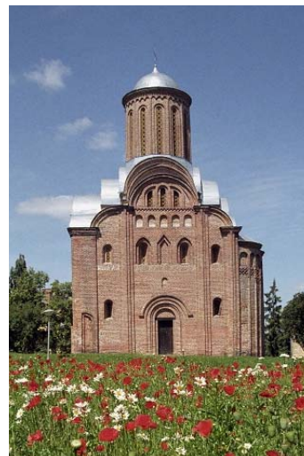
П'ятницька церква (XII ст.)