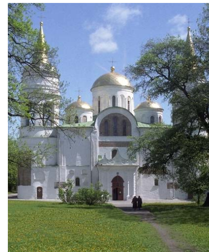
Спаський собор (XI ст.)

управління Національного банку України), двоповерховий корпус для губернських установ (сучасне приміщення обласної державної адміністрації), а на перехресті вулиць Шевченка та Кирпоноса (раніше Богоявленська та Олександрівська) у 1860 р. збудували приміщення для першого поліцейського управління (нині це міська прокуратура). У 1912 р. на розі вулиць Магістратської та Олександрівської виріс гарний двоповерховий будинок, збудований спеціально для контори Державного банку (тепер тут розташована Чернігівська міська рада). У 1939 р. на місці військових казарм збудували кінотеатр ім. М. Щорса.