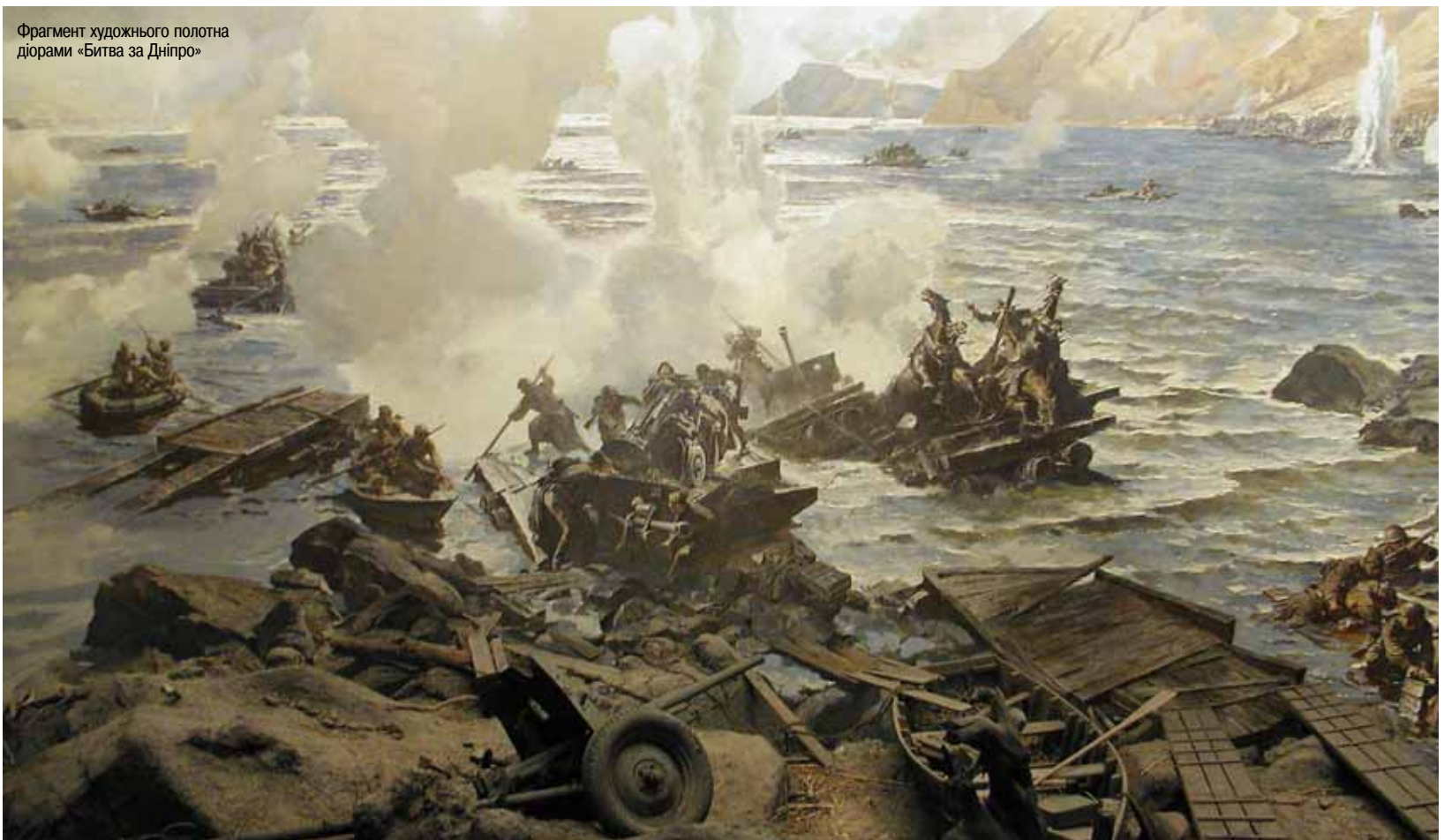
Фрагмент художнього полотна діорами «Битва за Дніпро»