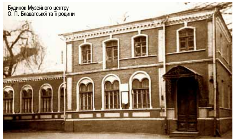
Будинок Музейного центру О. П. Блаватської та її родини