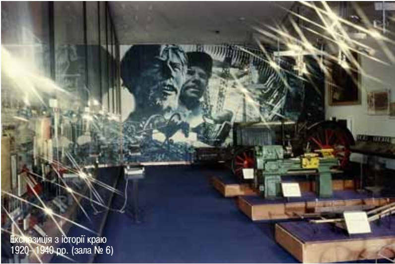
Експозиція з історії краю 1920–1940 рр. (зала № 6)