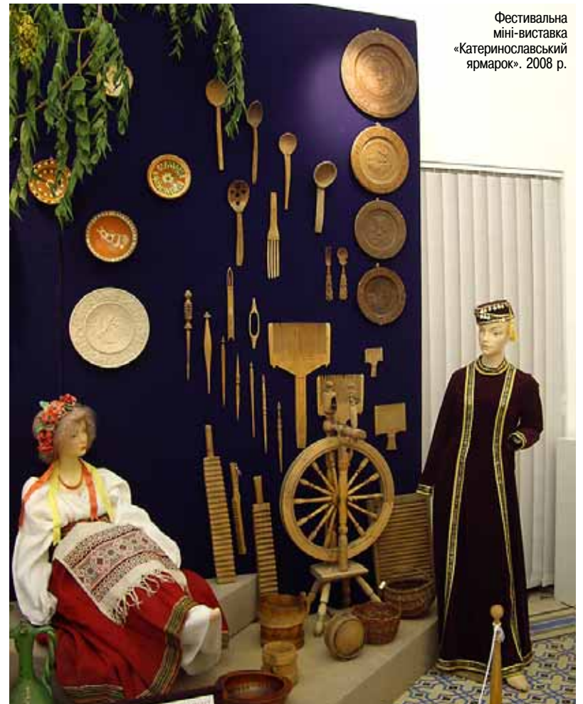
Фестивальна міні-виставка «Катеринославський ярмарок». 2008 р.

в країні в цілому і Дніпропетровській області зокрема, так і сучасні проблемні питання музейної галузі. 16 — 23 вересня 2008 р. на базі Дніпропетровського історичного музею відбувся 2-й Всеукраїнський музейний фестиваль «Музей в сучасному поліетнічному світі», де були присутні 105 музеїв. Впродовж своєї діяльності музей отримав визнання як від владних структур і громадськості, так і колег-музеезнавців. Неодноразово нагороджувався грамотами і подяками обласної і міської влади, має орден Святого Станіслава, Диплом лауреата премії ім. Д.І. Яворницького Всеукраїнської спілки краєзнавців, Диплом співдружності Московського міжнародного фестивалю «Інтермузей-1999», Диплом Гран-прі III-ї Красноярської музейної бієннале, Диплом «Краща музейна подія 2005 р.» та III місце в конкурсі «Краща музейна подія 2008 р.» (за перший та другий музейні фестивалі) від МФ «Україна 3000», Диплом Гран-прі Першого всеукраїнського музейного фестивалю, дипломи переможця у різних номінаціях Другого всеукраїнського музейного фестивалю. Про професіоналізм колективу музею свідчить і той факт, що серед наукових співробітників працюють 3 кандидати історичних наук, 6 заслужених працівників культури та 3 нагороджених орденами України.