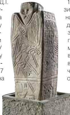
Керносівський ідол — унікальна кам'яна стела індоарійських племен III тис. до н. е.