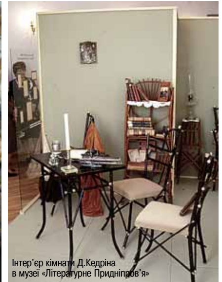
Інтер'єр кімнати Д.Кедріна в музеї «Літературне Придніпров'я»