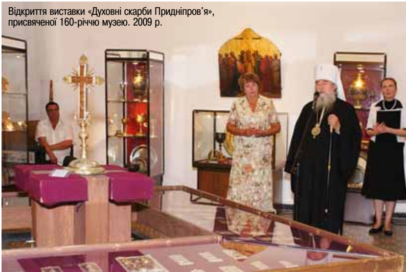
Відкриття виставки «Духовні скарби Придніпров'я», присвяченої 160-річчю музею. 2009 р.