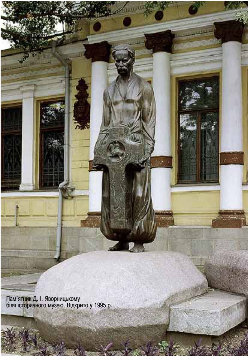
Пам'ятник Д. І. Яворницькому біля історичного музею. Відкрито у 1995 р.

(колекція тканин, вишивки), «Духовні скарби Придніпров'я» (культовий метал), «Почесні громадяни Катеринослава — Дніпропетровська», «Дніпропетровськ — сьогодні» (серія фотовиставок), «Козацькому роду нема переводу», «Китайгород козацький», «Не лише гроші... (ювілейні монети України)», «Нові надходження археологічних пам'яток», «Герби Придніпров'я», «Віхи музейної біографії (до 160-річчя музею)» тощо;