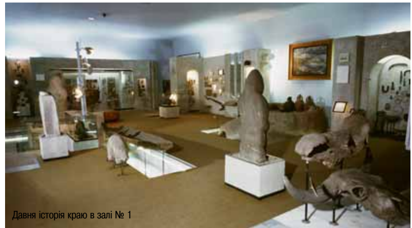
Давня історія краю в залі № 1