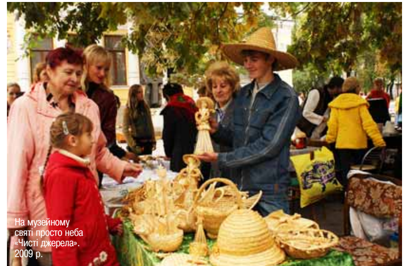
На музейному святі просто неба «Чисті джерела». 2009 р.

культурологічні заходи, зустрічі, вечори, концерти, презентації, музейні вітальні, нічні сеанси «Людина і Степ», свята просто неба «Чисті джерела» та «Гончарне коло», гра-вікторина «Джерело», заняття для дітей, функціонують краєзнавчі та культурологічні гуртки, клуби, студія «Жива глина» тощо. Широкою популярністю серед учбових закладів міста користується музейна програма «Музей і діти» (музейні і виїзні заняття з історії та культури краю для школярів), розроблена співробітниками музею в 1989 р. З 1999 р. втілюється в життя проект «Музейні гастролі» — обмінні виставки з музеями України й світу, за яким відбулося понад 30 різноманітних виставок, що дають можливість мешканцям нашого краю, а також різних регіонів країни ознайомитися з історико-культурною спадщиною України й світу. Музей є науково-методичним центром для всіх музеїв області — 7 комунальних, 1 відомчий та 144 громадських (43 народних), здійснює координацію краєзнавчої роботи, бере участь у пам'ятко-охоронній діяльності.