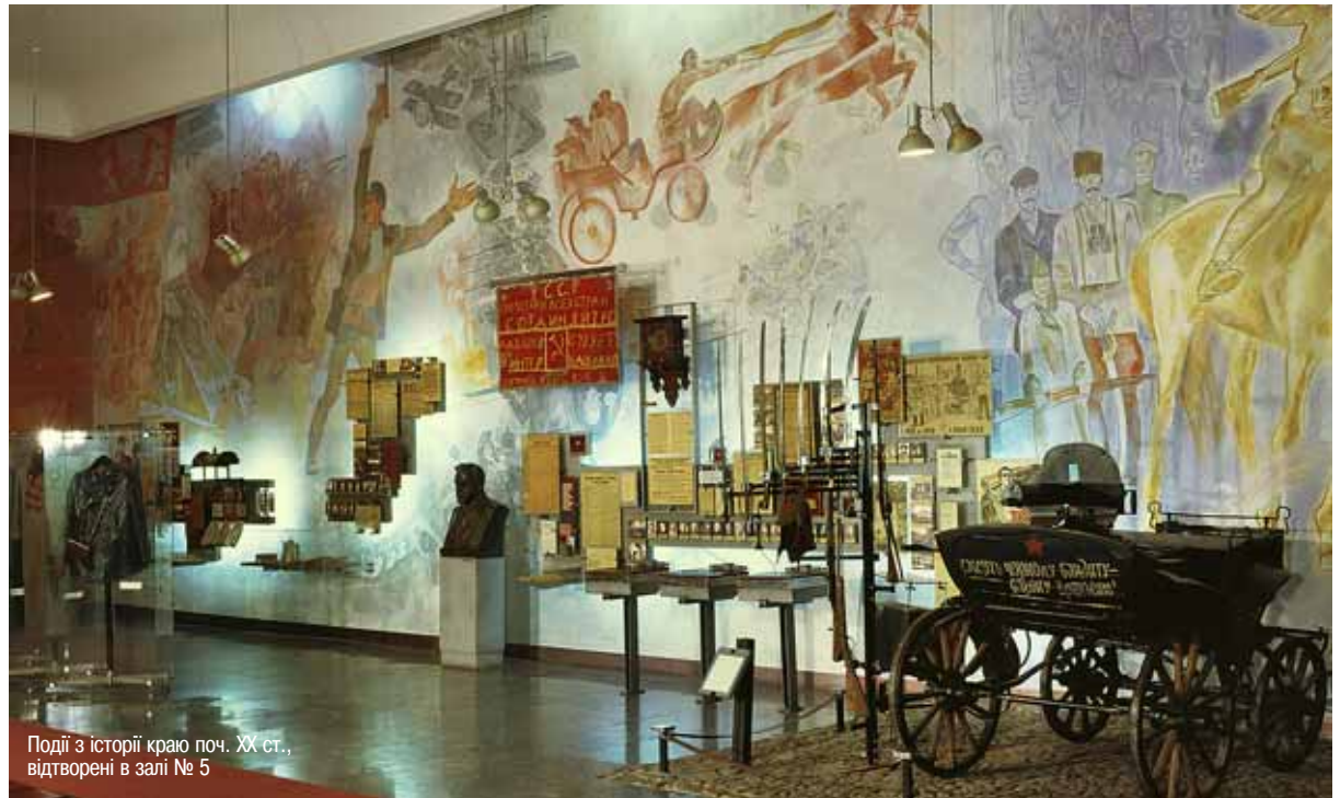
Події з історії краю поч. XX ст., відтворені в залі № 5

XIV — кінці XVIII ст. Історія запорозького козацтва»; зала № 3 «Катеринославська губернія в кінці XVIII — сер. XIX ст.»; зала № 4 — «Соціально-економічний, політичний, культурний розвиток краю в 1861–1916 рр.»; зала № 5 — «Катеринославська губернія в добу війн та революційних змагань 1917–1920 рр.»; зала № 6 — «Історія краю 1921 — 1941 рр.»; зала № 7 — «Дніпропетровська область в роки Другої світової та Великої Вітчизняної війни»; зала № 8 — «Дніпропетровська область в 1946 — 2000-х рр.»; зала № 9 — «Це не повинно повторитися» (стаціонарна виставка з історії репресій, голодомору 1920 — 1950-х рр. Крім того — 4 виставочні зали, в яких постійно експонується понад 50 різноманітних виставок мистецтвознавчого та історико-культурного характеру як з власного музейного зібрання, так і з інших музеїв та приватних колекцій України й світу: «Арсенал музею — холодна та вогнепальна зброя», «Годинники в колекції ДІМ», «Ікони з зібрання музею», «Катеринославський ярмарок», «Добрих рук майстерність»