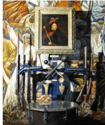
Фрагмент експозиції з історії Визвольної війни українського народу середини XVII ст. в залі № 2

1) історичний музей: 9 експозиційних залів з історії краю з найдавніших часів до сьогодення, художнє оформлення залів музею здійснене санкт-петербурзькими художниками під керівництвом В. Л. Ривіна та В.І. Короткова і науковим керівництвом А.Ф. Ватченко, у 1979 р. творчу групу оформлювачів музею та діорами (у складі 7 осіб) було нагороджено Державною премією ім. Т. Г. Шевченка: зала № 1 — «Край у період давньої історії — від палеоліту до часів Київської Русі»; зала № 2 — «Україна й край в