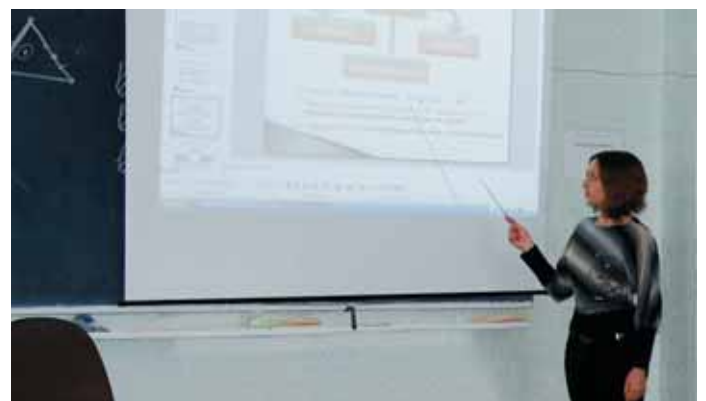
Занятие на отделении обслуживания компьютерных систем