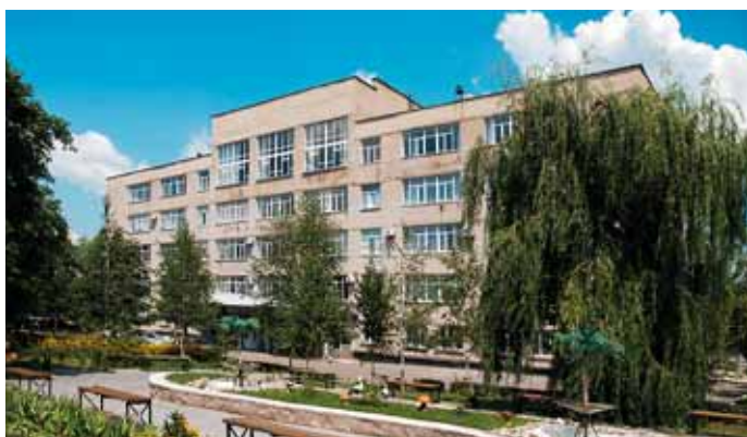
Первомайский колледж НУК имени адмирала Макарова

Выпускники отделения имеют возможность продолжить обучение в высших учебных заведениях III–IV уровней аккредитации. Здесь подготовлено более 700 младших специалистов в области экономики и бухгалтерского учета.