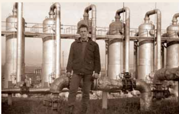
Будни Газпрома, 1988 г.

ного общественного процесса — формирования будущей кадровой базы определенной отрасли государственной экономики.