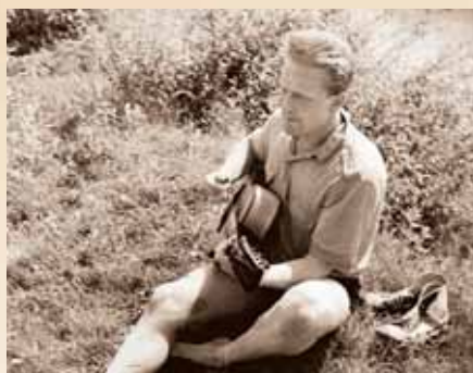
На отдыхе, 1987 г.