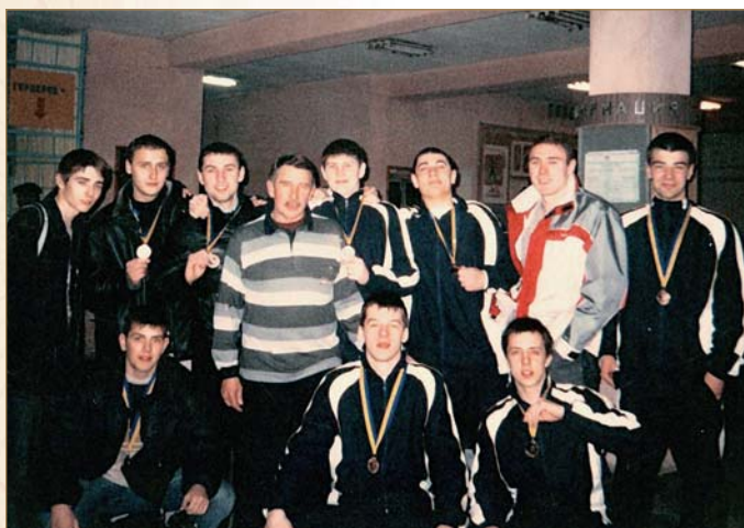
Збірна команда ОНМУ з водного поло. Призери першості ВНЗ