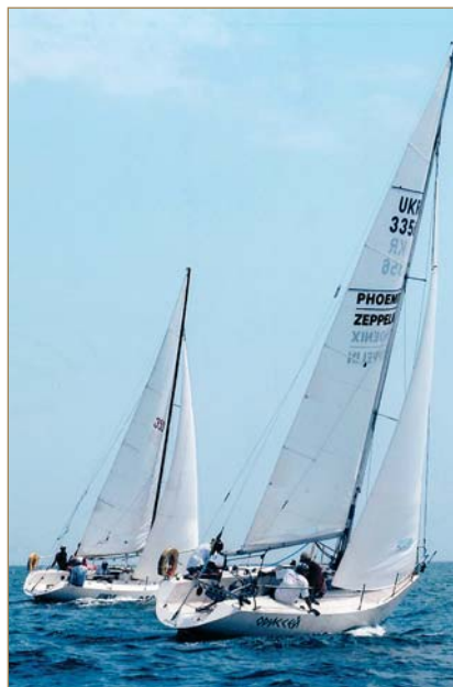
Яхти «Одісей» і «Аріель» — переможці кубків портів Чорного моря 2008–2009 рр.

У вільний від занять час для студентів організовано оздоровчі групи, в яких 138 осіб займаються атлетизмом,