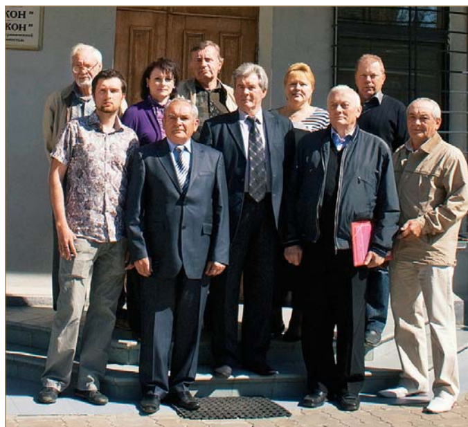
Сотрудники ООО «Стикон» — выпускники ОНМУ

За весомые трудовые заслуги, значительный вклад в строительство жилья, гражданских и промышленных объектов, повышения эффективности строительного производства на основе передовых современных строительных технологий, плодотворную благотворительную деятельность в 2007 г. ООО «Стикон» был награжден Почетной грамотой Кабинета Министров Украины.