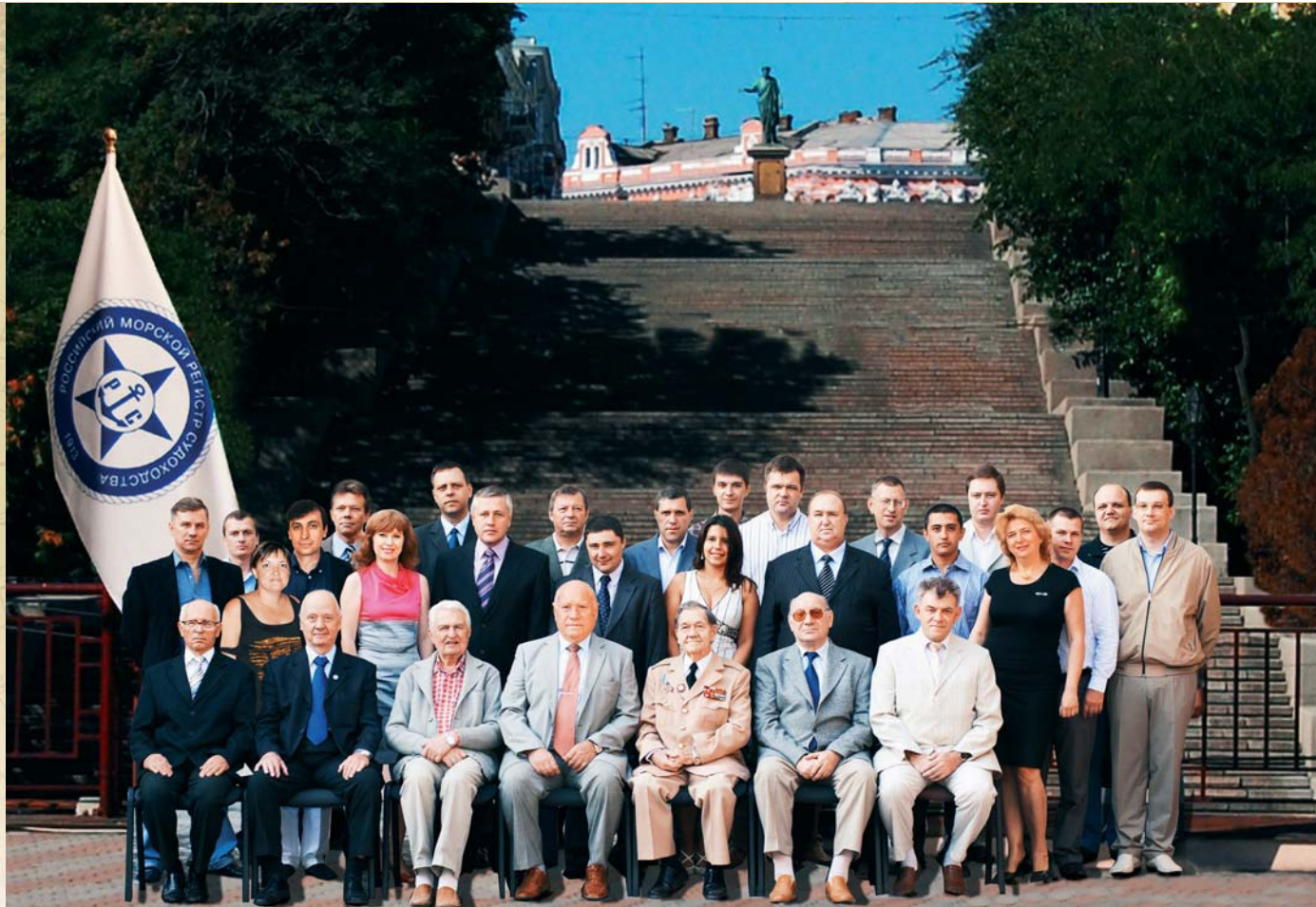
Выпускники ОНМУ — сотрудники ЗАО «РУ РС», г. Одесса