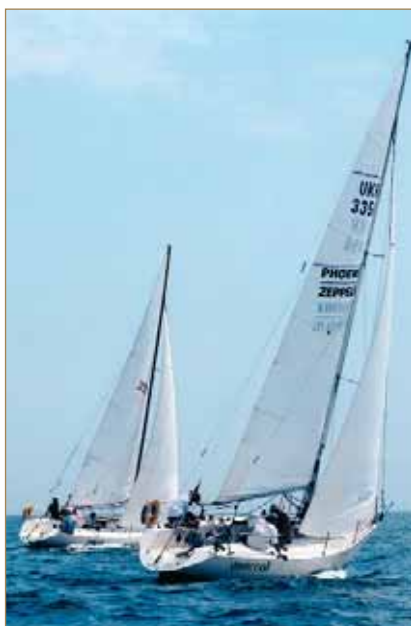
Яхти «Одісей» і «Аріель» — переможці кубків портів Чорного моря 2008–2009 рр.

У вільний від занять час для студентів організовано оздоровчі групи, в яких 138 осіб займаються атлетизмом,