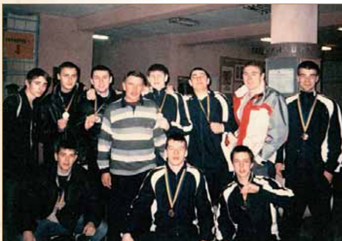
Збірна команда ОНМУ з водного поло. Призери першості ВНЗ