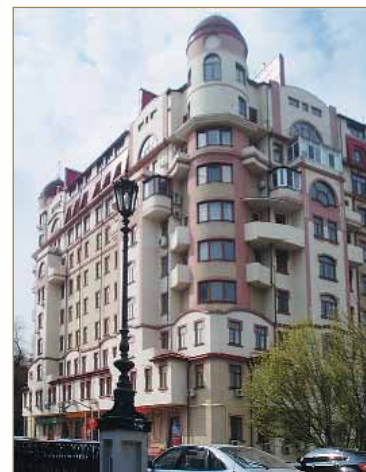
Объекты ОП «СУ-463 ОДО «Черноморгидрострой»