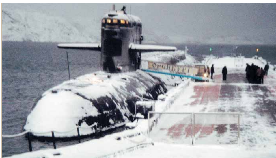
Ходовые испытания ПЛА «Оренбург», 2004 г.