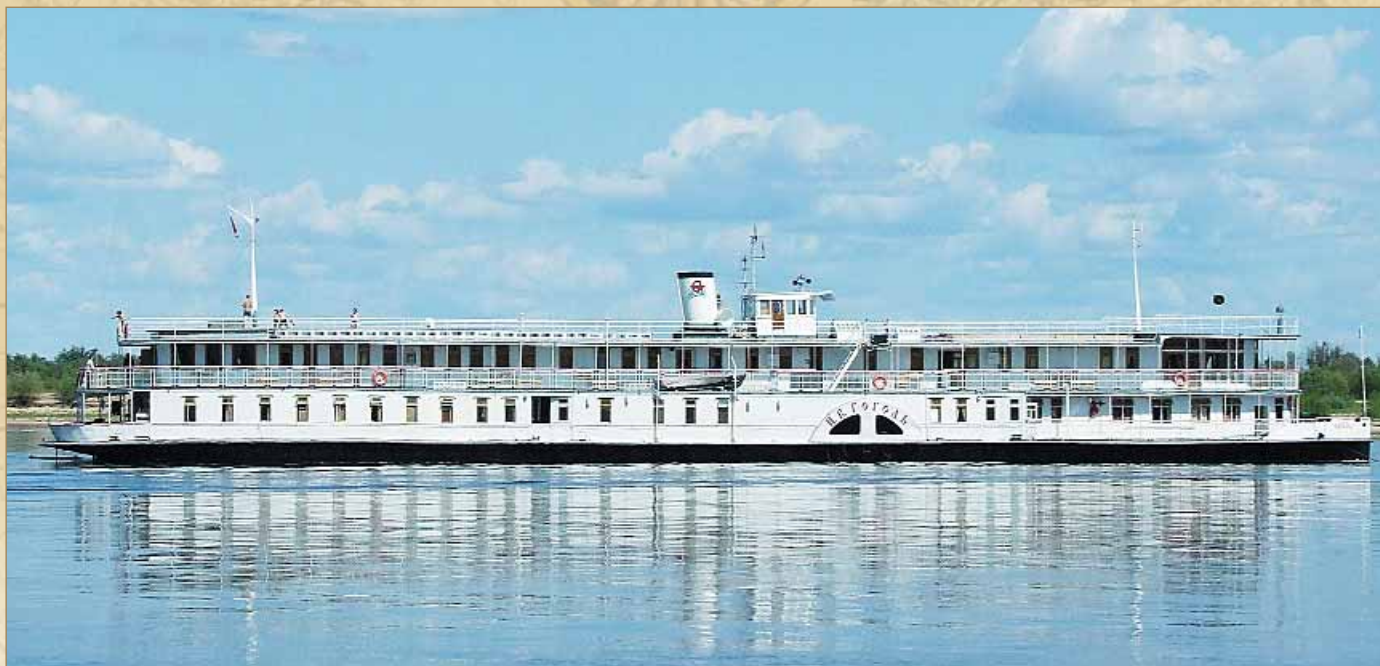
ПХ «Н. В. Гоголь» на Северной Двине, 2006 г.

Моя работа была оценена — несколько медалей и звание «Заслуженный конструктор Российской Федерации».