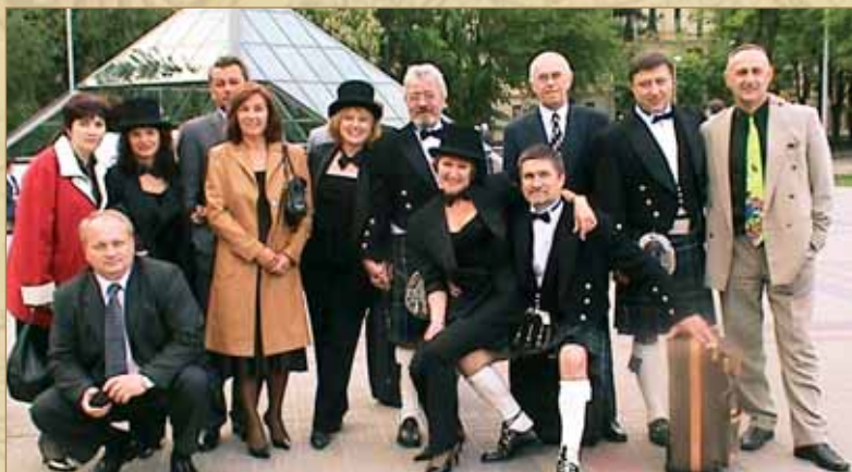
После выступления на 43-й (Вентспилской) Балтийской встрече. Рига, май 2004 г.