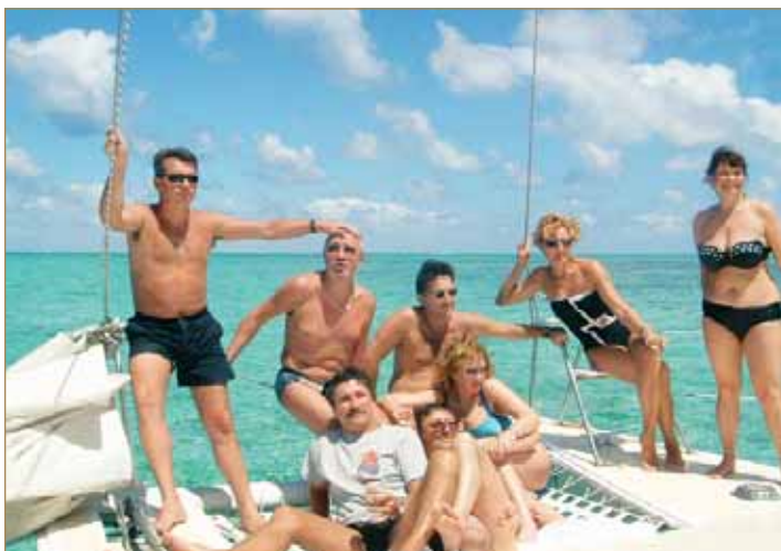
Восемь водников разных лет выпуска на морской прогулке. О. Маврикий, декабрь 2002 г.