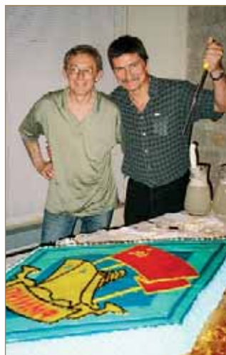
Праздничный торт на 44-й Балтийской встрече. Рига, май 2005 г.

ной техники. Позже он убедил руководство в целесообразности передачи группы бербоут-чартерных судов «Сокомфлота» в собственность пароходства.