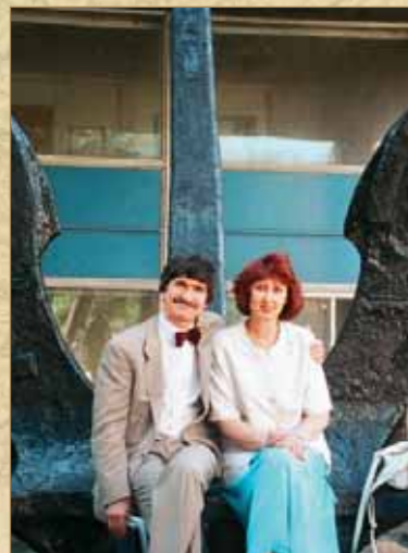
Таллинские водники встретились у стен alma mater. Одесса, июнь 1999 г.

студенческом отряде в Тикси, а также во время плав-практики на балкере «Закарпатье», производственной практики в Ленинграде, преддипломной практики в Латвийском морском пароходстве.