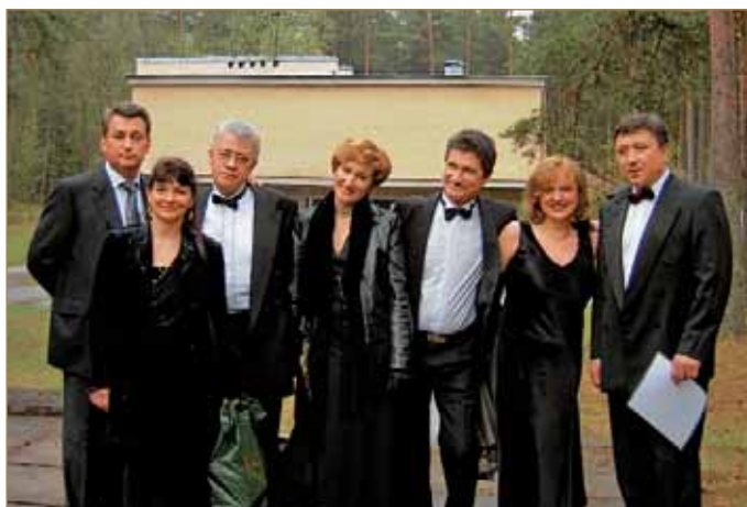
Команда Лондона на 42-й встрече выпускников ОИИМФа. Санкт-Петербург, май 2003 г.