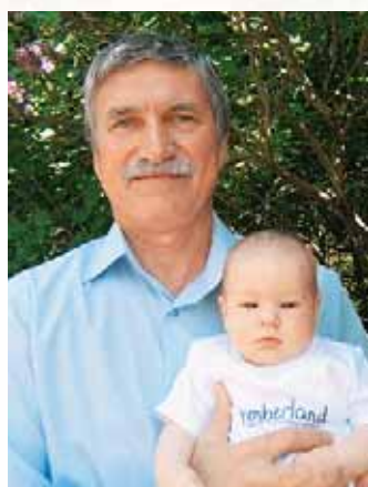
Два Водолея рождённых в годы Дракона с разницей в 60 лет. Апрель 2012 г.

К началу 1994 г. в разных компаниях Лондона сосредоточилось около дюжины водников. Память об Одессе,