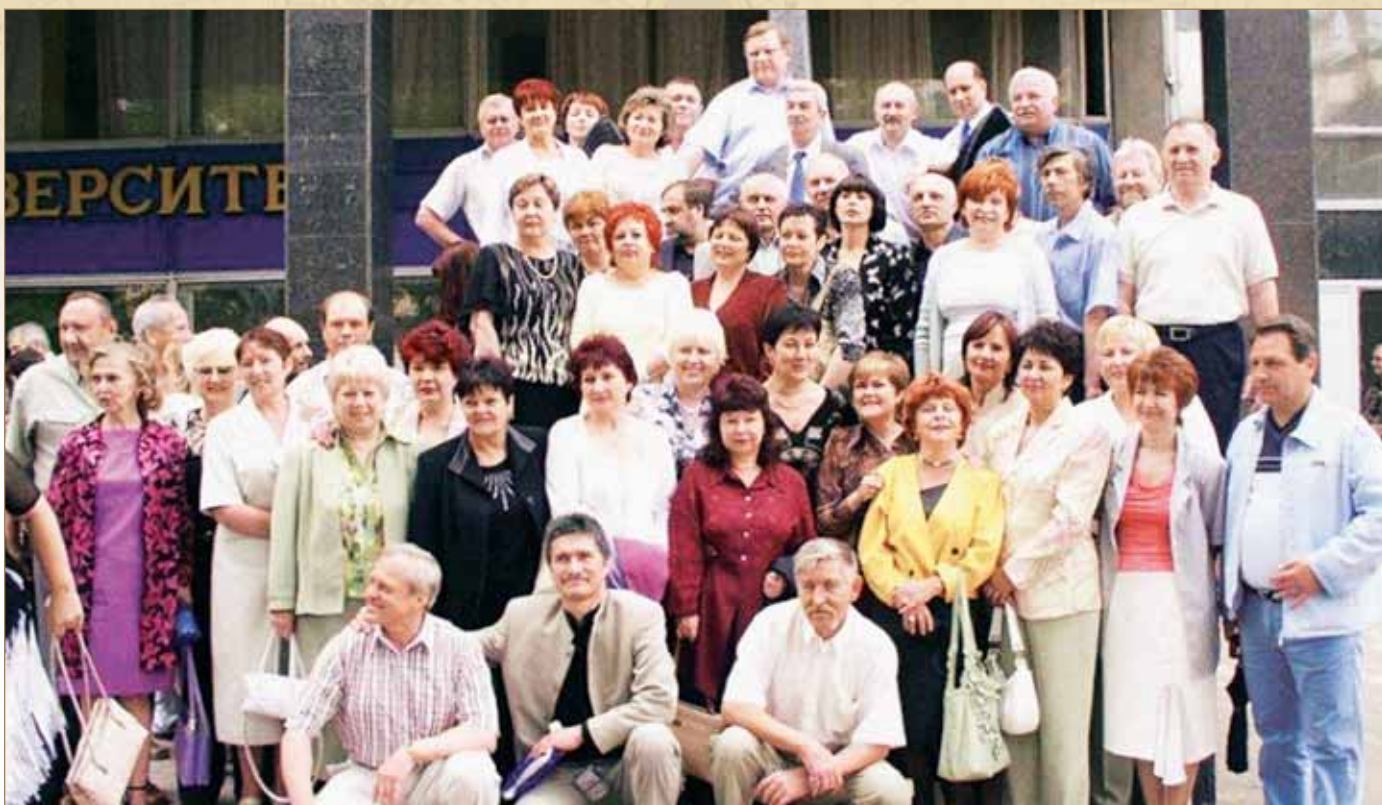
Тридцатилетие выпуска. Одесса, июнь 2004 г.