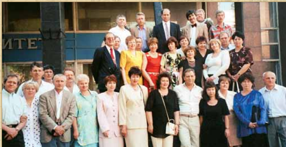
Эксы выпуска 1974 г. на юбилейной встрече. Одесса, июнь 1999 г.