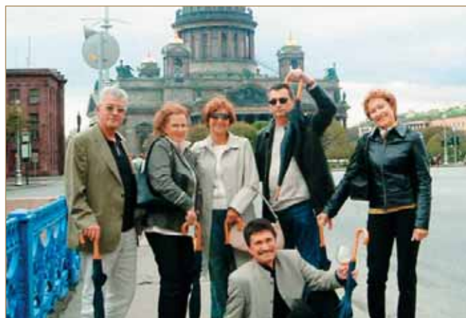
Прогулка по 300-летнему городу. Санкт-Петербург, май 2003 г.