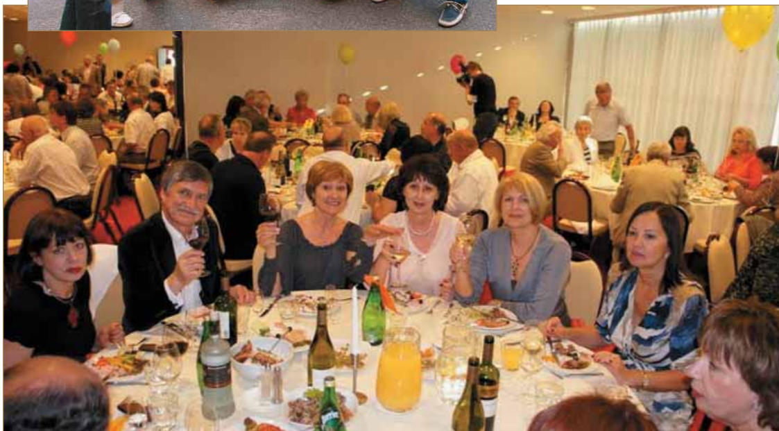
Вперёд, друзья! Нас ждёт банкет!