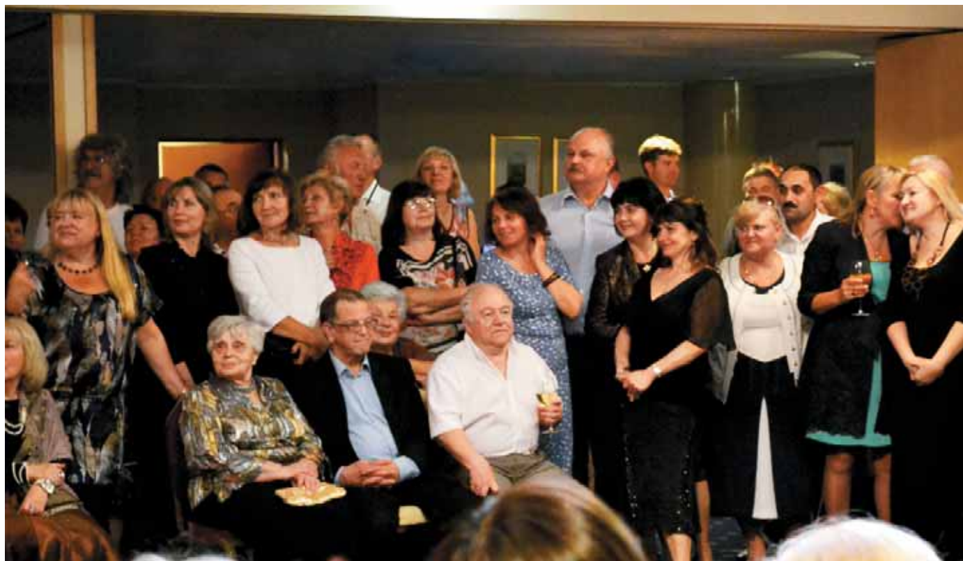
Ветеранам — особый почёт