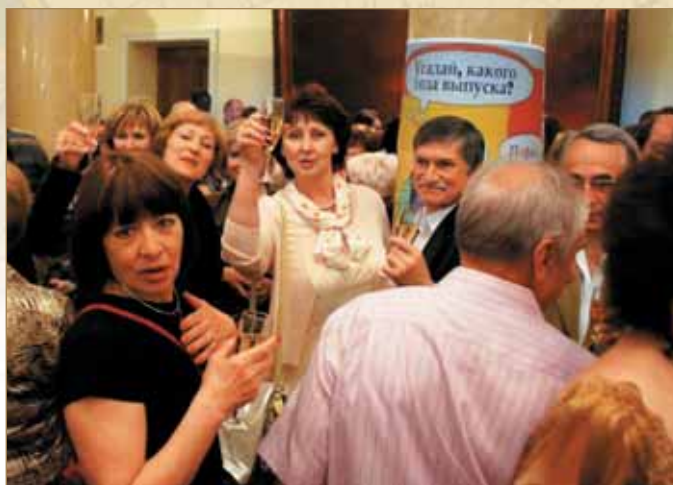
За Встречу! Традиционный фуршет

Обязательной традицией стала дань памяти водникам, которые не вернулись с войны. «Нас могло быть сегодня больше, но была на земле война...», — при чтении этих строк со сцены редко у кого из сидящих в тёмном зале не заблестят глаза, увлажняясь от затронутых чувств. К сожалению, всё больше одноклассников уходит из жизни в свой срок. Объявляется минута молчания и все встают, склонив головы в звенящей тишине.