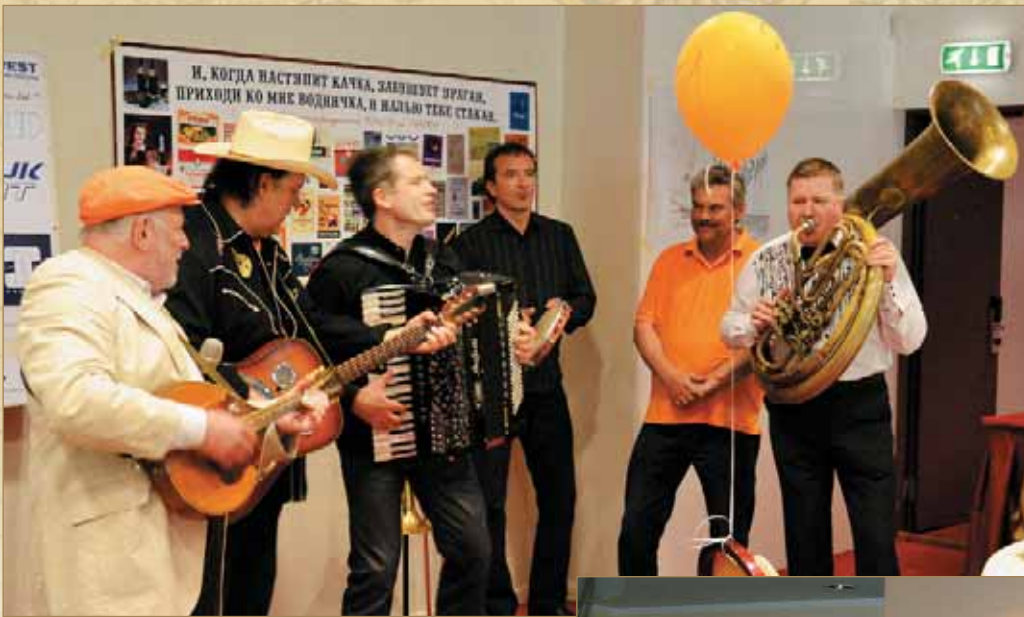
Поздравления от Анне Вески