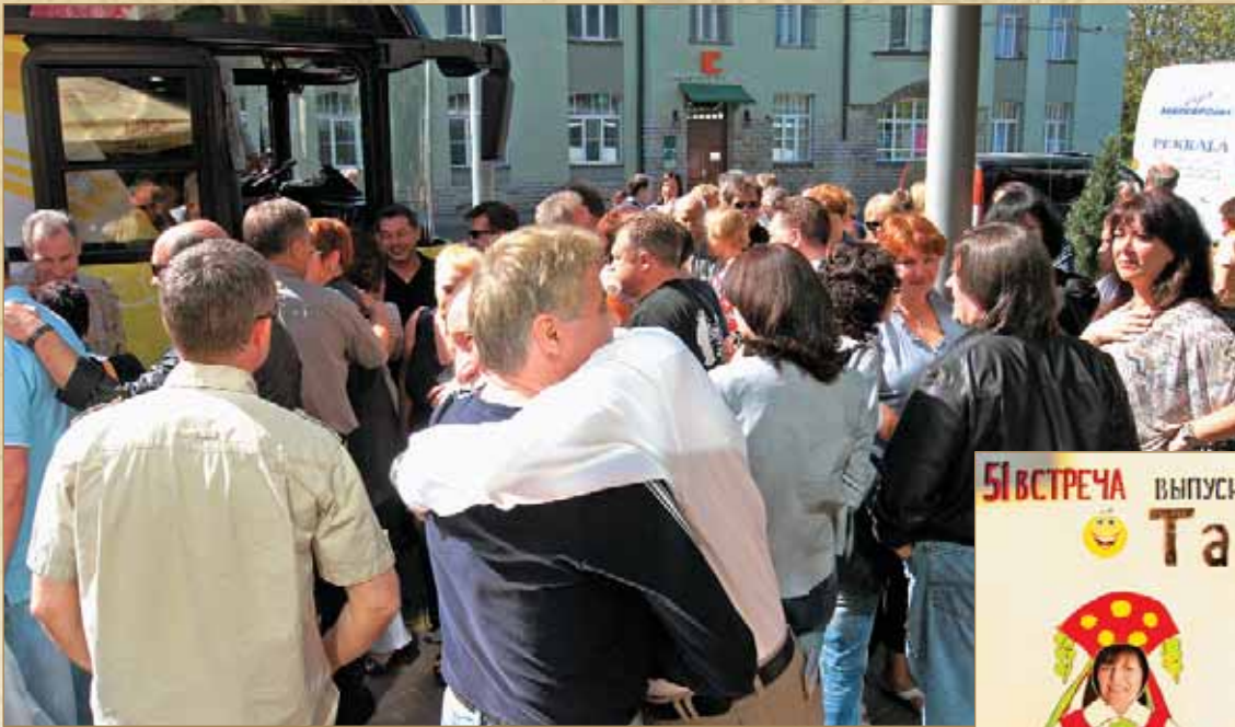
Под мари «Прощание Славянки»

Всё в этом мире имеет свойство заканчиваться. Подходит к концу очередная встреча. Кто-то, с трудом вырвавшись из объятий недолгого сна, заключает в объятия того, кто ещё не ложился. Таллинцы обнимают калининградцев и долго машут руками в окна автобуса, который никак не может собраться и уехать. Потом приходит очередь клайпедчан, петербуржцев, вентспилсцев и рижан. Ну и конечно, одесситы! Куда же без них! К обеду воскресенья об отшумевшей встрече напоминают лишь недоумённые лица местных жителей, осунувшиеся от усталости работники отеля и мешки под своими глазами в отражении зеркала. Становится как-то грустно. Радует только одна мысль: если выпускники Одесского Водного сделали это 51 раз, то, без сомнения, доведут счёт до 100. Пройдёт всего лишь год и они соберутся опять, и опять, и ЕЩЁ РАЗ.