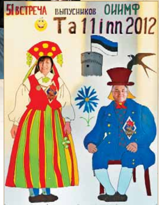
На память о встрече

Всё в этом мире имеет свойство заканчиваться. Подходит к концу очередная встреча. Кто-то, с трудом вырвавшись из объятий недолгого сна, заключает в объятия того, кто ещё не ложился. Таллинцы обнимают калининградцев и долго машут руками в окна автобуса, который никак не может собраться и уехать. Потом приходит очередь клайпедчан, петербуржцев, вентспилсцев и рижан. Ну и конечно, одесситы! Куда же без них! К обеду воскресенья об отшумевшей встрече напоминают лишь недоумённые лица местных жителей, осунувшиеся от усталости работники отеля и мешки под своими глазами в отражении зеркала. Становится как-то грустно. Радует только одна мысль: если выпускники Одесского Водного сделали это 51 раз, то, без сомнения, доведут счёт до 100. Пройдёт всего лишь год и они соберутся опять, и опять, и ЕЩЁ РАЗ.