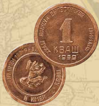
Атрибуты встреч: пригласительный билет, «свои» деньги

Ей предшествуют серьёзные собрания организаторов, весёлые репетиции творческого коллектива и разухабистые заседания и тех, и других для поддержания духа. После общей встречи — обязательный разбор полётов с просмотром снятых видео- и фотоматериалов. Собраться на коньячок под шашлычок в День работников морского и речного транспорта — святое дело. Ну и решающим событием, предвкушающем следующую встречу, является традиционный всеэстонский зимний съезд водников, проводимый под треск крещенских морозов, но в очень тёплой и творческой атмосфере.