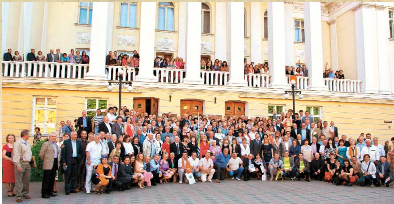
Таллин — 2012: участники 51-й встречи

И менно так можно назвать уникальное мероприятие, которое благодаря количеству людей, принимающих в нем участие, могло бы претендовать на запись в Книге рекордов Гиннеса. И записи этой до сих пор нет только лишь потому, что никто не озадачился этим вопросом. А не озадачился никто потому, что всем и так хорошо. Как вы могли догадаться, речь идёт о ежегодных традиционных встречах выпускников ОИИМФа, волей распределительных комиссий оказавшихся в портах Балтийского моря. Продвижение к Гиннесу водники Балтии решили начать со статьи в этом уникальном издании, страницы которого вы сейчас листаете.