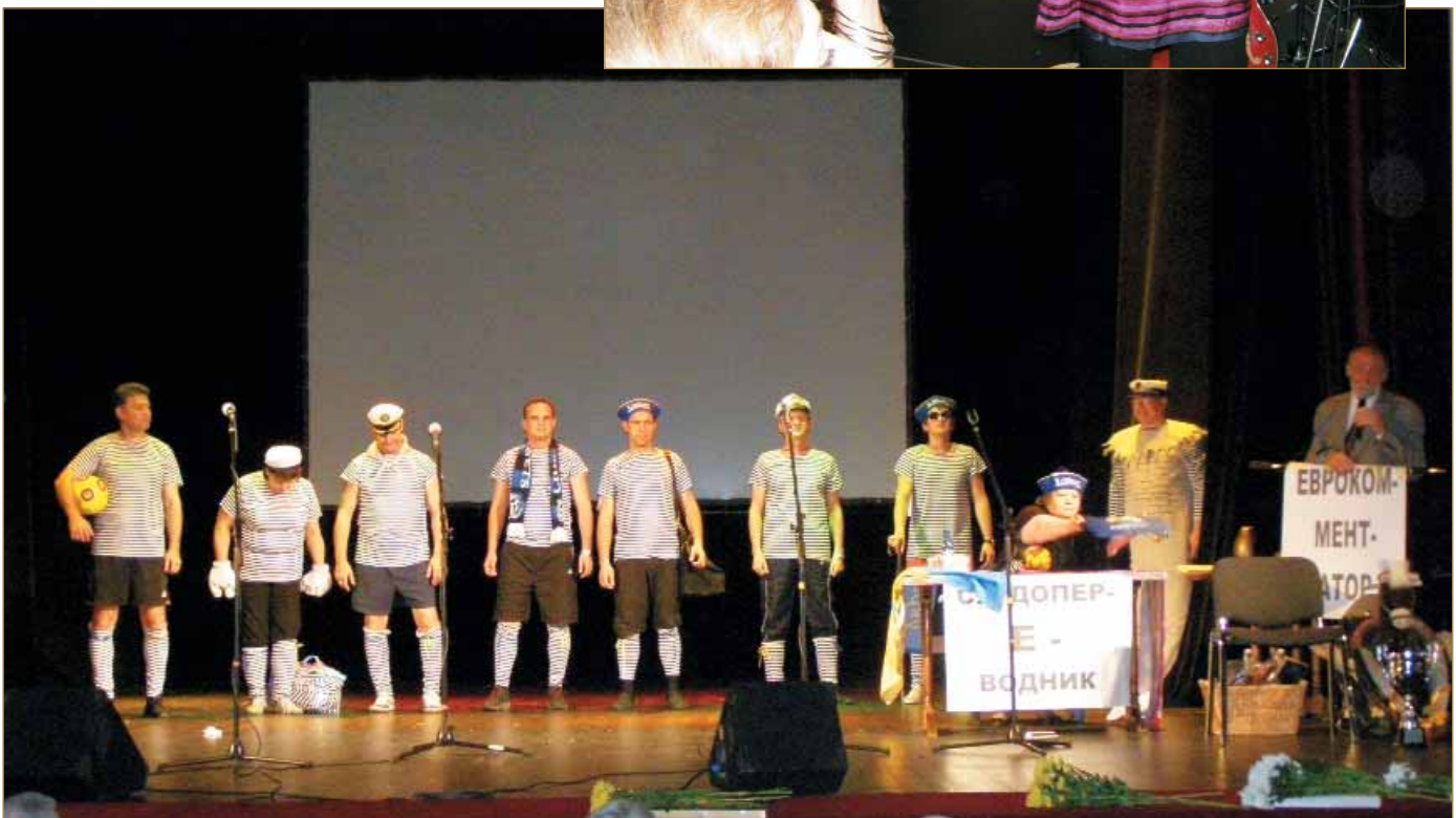
На сцене — сборная водников из Одессы