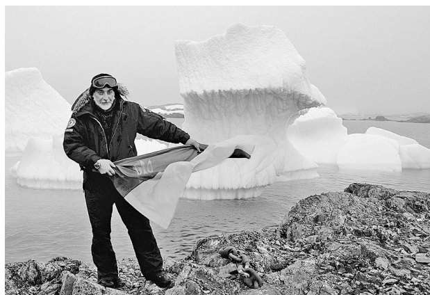
Під час відбирання проб. XIII Українська антарктична експедиція, о. Галіндес

Він — лауреат премії імені Д. К. Заболотного НАН України (1998), премії Сороса. В 2005 р. за екосистемний моніторинг вірусних інфекцій (діагностику та профілактику) був удостоєний Державної премії України в галузі науки і техніки. Також нагороджений медаллю Ярослава Мудрого Академії наук вищої школи України (2007), почесними грамотами ректора Київського національного університету імені Тараса Шевченка, Подякою Президента України (2009).