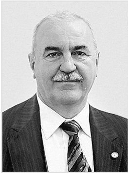
Завідувач кафедри оториноларингології з курсом хірургії голови та шиї Івано-Франківського національного медичного університету, доктор медичних наук, професор