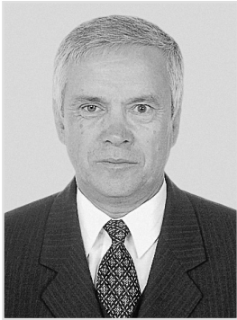
Директор ТОВ «Науково-технічний центр «Монтажспецтехніка»